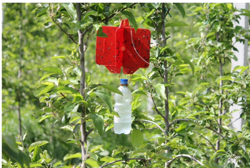
Trappola con colla e alcole