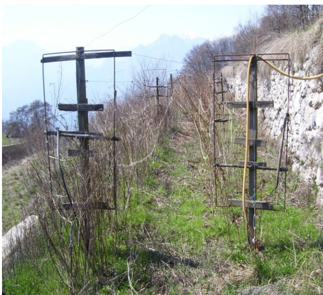
Lampone unifero prima della potatura

Effettuare potatura per diradamento e selezione tralci per la produzione.