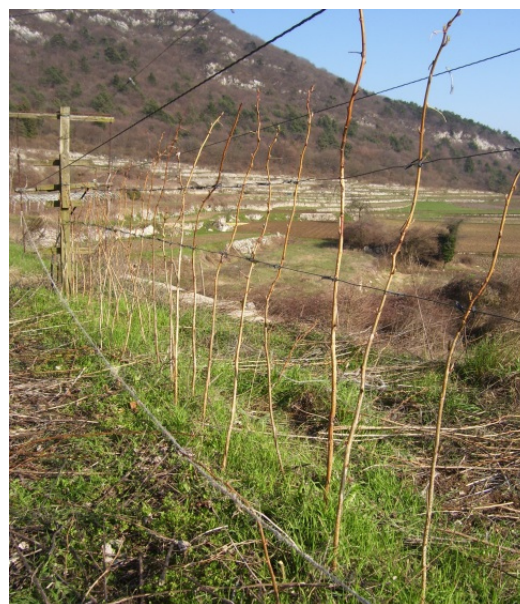
Lampone unifero dopo la potatura