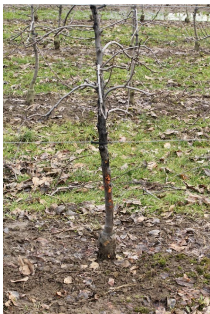
Pianta attaccata da bostrico