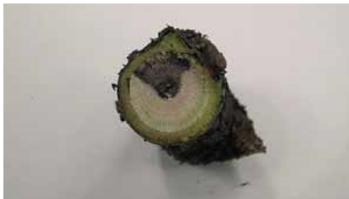
Necrosi a forma di "V" su un ramo di ribes infetto da eutipiosi