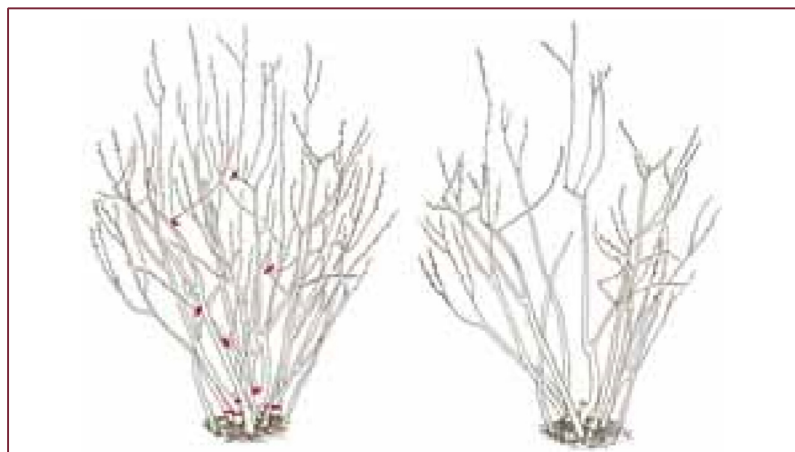
Potatura del mirtillo