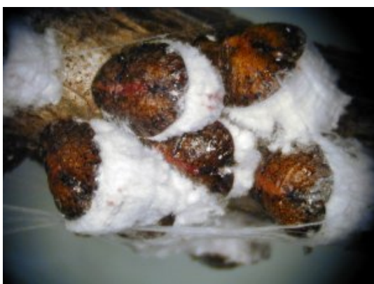
Cocciniglia ribes: Pulvinaria ribesiae