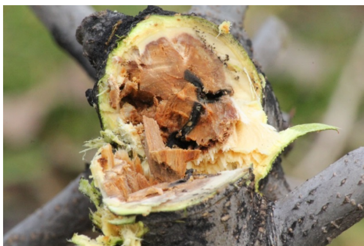
Bostrico nel fusto