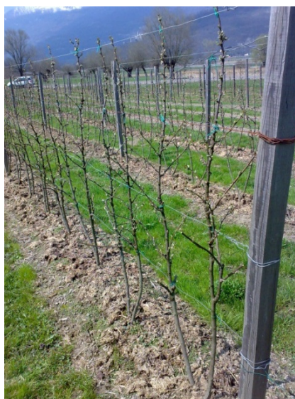
Impianto di ribes potato