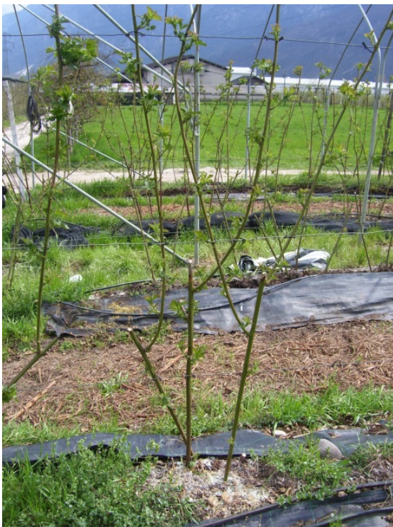
Pianta di mora con buona vigoria dopo la potatura (la fase fenologica riportata nella foto è già corrispondente ad allungamento dei germogli)