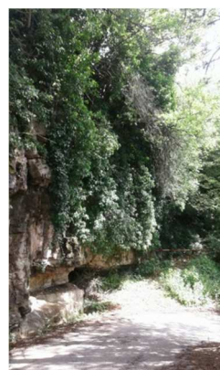
Piante di edera presenti ovunque