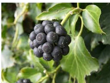
Piante di edera su cui avvengono le prime ovideposizioni di Drosophila zusukii