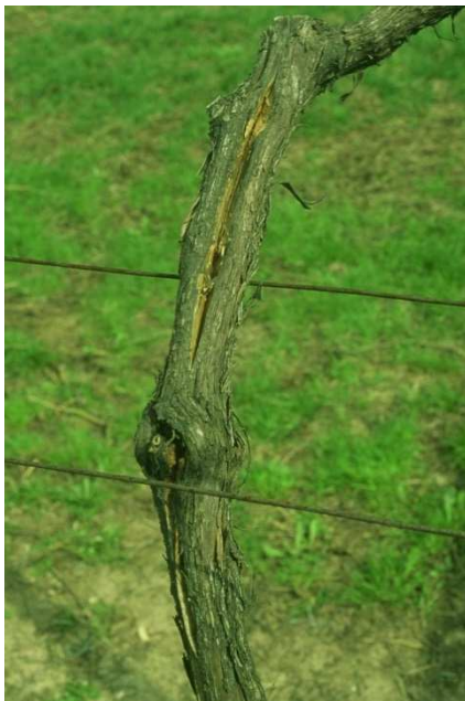
Spaccatura della vite a causa del freddo invernale

Eeguire eventualmente le operazioni di letamazione e di concimazione minerale.