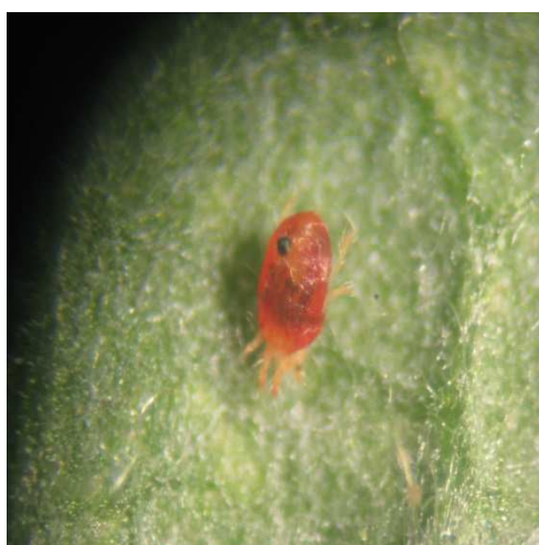
Ragno rosso (forma svernante)