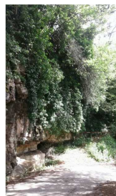
Piante di edera presenti ovunque