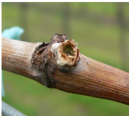
Rosura da nottua

Nelle zone più precoci le gemme della vite sono a 5-6 foglie formate, in anticipo di circa 10 giorni rispetto allo scorso anno. Le classiche rosure di nottue si riscontrano solo nei vigneti ad altitudini elevate allo stadio fenologico di inizio germogliamento e quindi iniziare la raccolta notturna oppure intervenire alla sera con un trattamento insetticida con Indoxacarb solo nei vigneti ove i danni riscontrati nelle annate precedenti sono stati consistenti (maggiori 5%).