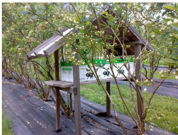
Corretta postazione per arnie