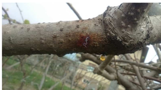
Presenza di PSA su tralcio di actinidia

Per contenere la batteriosi, finita la potatura, è bene proteggere e disinfettare le ferite con un trattamento a base di prodotti rameici.