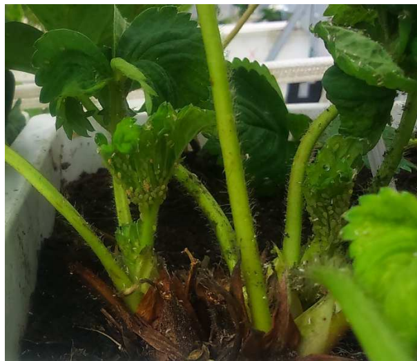
Afidi (infestazione precoce)