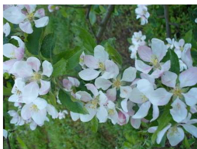
Stadio fenologico di piena fioritura

Stadio fenologico: Siamo nel periodo di sfioritura.