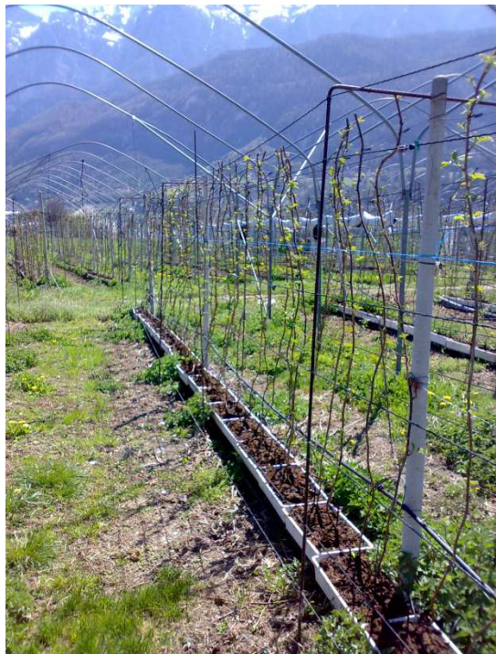
Pianta di lampone fuori suolo appena esposte

Alle quote inferiori (< 600 m slm) iniziare a posizionare le piante del vivaio nell'impianto utilizzando vasi più grandi (almeno di 7-8 litri) oppure vaschette aggiungendo torba o cocco. Fare attenzione ai germogli già presenti nello spostamento delle piante. Cominciare subito con la fertirrigazione standard.