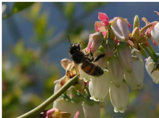
Ape mentre impollina mirtillo