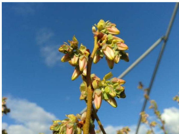
Imminente fioritura di mirtillo