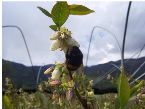
Bombo mentre impollina mirtillo