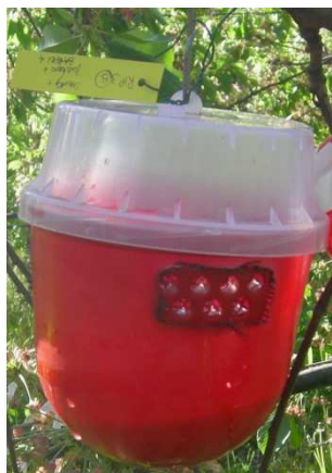
Trappola per Drosophila suzukii (Biobest)

Le nuove trappole della Biobest color rosso e caricate con una miscela di aceto di mela (150 ml), vino rosso (50 ml) e un cucchiaino di zucchero di canna grezzo (o Droskidrink) sono le più attrattive poichè catturano un maggior numero di individui di Drosophila suzukii a quelle impiegate nelle annate precedenti.