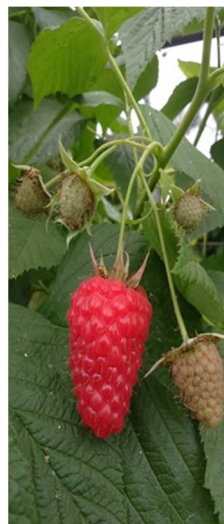
Frutto maturo di lampone