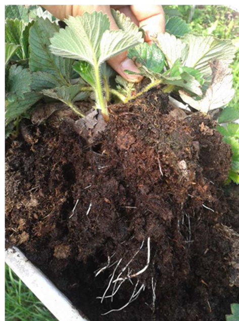
Radicazione nuove piante