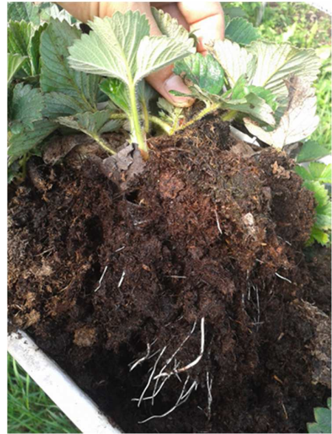
Radicazione nuove piante