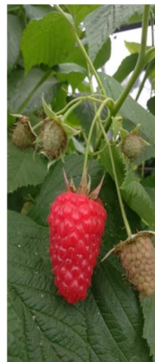
Frutto maturo di lampone