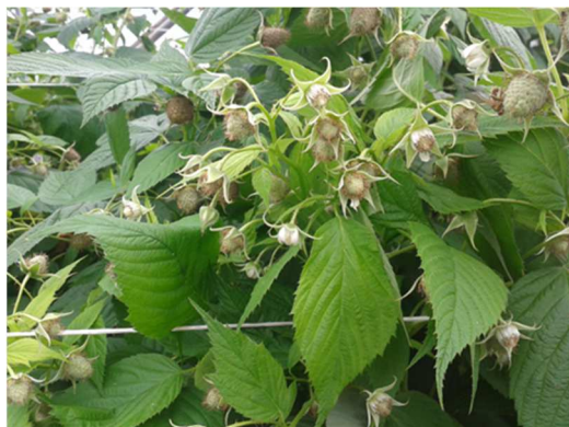
Fiori e frutti allegati di lampone

Si è ottenuto l'uso straordinario di due principi attivi per la gestione di Drosophila suzukii : uno dal 23 giugno 2017 al 20 ottobre 2017 e un altro dal 15 luglio 2017 all'11 novembre 2017.