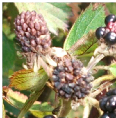
Peronospora su mora