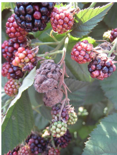
Botrite su mora

Si è ottenuto l'uso straordinario di un principio attivo per la gestione di Drosophila suzukii dal 23 giugno 2017 e al 20 ottobre 2017.