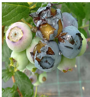
Danni causati dagli uccelli

Nei casi di Armillaria mellea o deperimento delle piante eseguire eventualmente Trichoderma harzianum rifai (ceppo T-22).