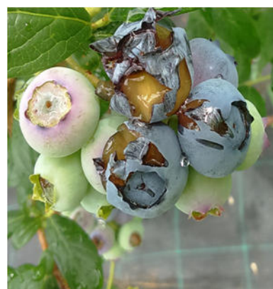
Danni causati dagli uccelli