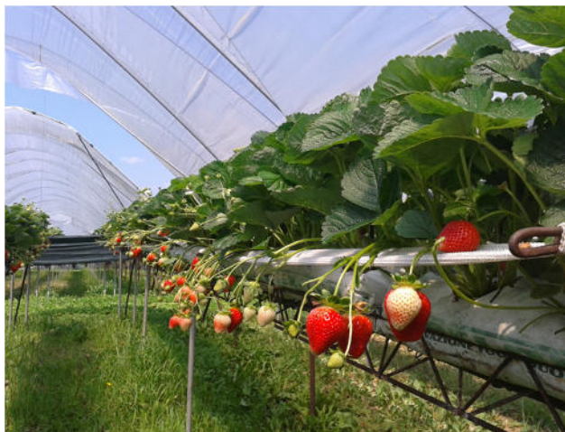
Fragola in fase di maturazione