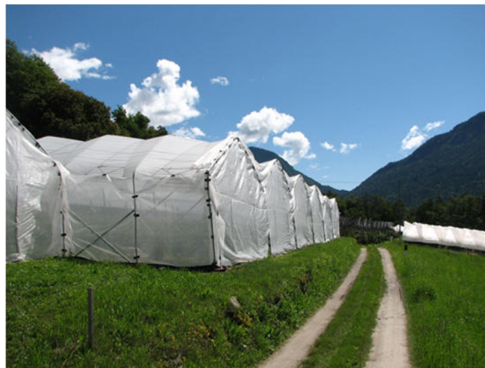
Chiusura con reti antinsetto per la difesa da Drosophila suzukii

Si è ottenuto l'uso straordinario di due principi attivi per la gestione di Drosophila suzukii : uno dal 23 giugno 2017 al 20 ottobre 2017 e un altro dal 15 luglio 2017 all'11 novembre 2017