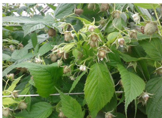
Fiori e frutti allegati di lampone

Se non si applicano le barriere fisiche negli impianti in raccolta eseguire la cattura massale per la Drosophila suzukii con trappole rosse caricate con 200 ml Droskidrink (o miscela di 150 ml aceto mele e 50 ml vino rosso) + 4 g di zucchero di canna disponendo le trappole ogni 2 m lungo tutto il perimetro dell'impianto ad un'altezza di 1-1,5 m da terra. Negli impianti non in produzione esporre comunque almeno 5-10 di queste trappole per ogni 1000 m 2 . Coloro che utilizzano le reti ant insetto possono installarle immediatamente prima dell'inizio invaiatura con l'accorgimento di posizionare al loro interno le arnie di bombi per l'impollinazione se la fioritura non è ancora terminata. Monitorare l'interno del campo solo dopo la chiusura delle reti per verificare eventuali entrate accidentali, utilizzando le trappole rosse come sopra descritto. Gestire con attenzione le reti ant insetto anche nei momenti di ingresso e uscita degli operatori, non lasciare mai aperto nemmeno per poco tempo. Si è ottenuto l'uso straordinario di due principi attivi per Drosophila suzukii : uno dal 23 giugno 2017 al 20 ottobre 2017 e un altro dal 15 luglio 2017 all'11 novembre 2017.