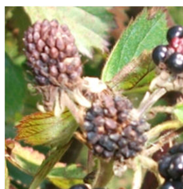
Peronospora su mora