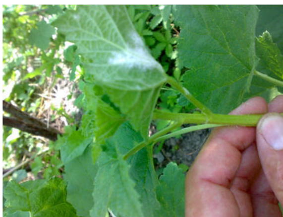
Oidio su ribes

Si è ottenuto l'uso straordinario di due principi attivi per la gestione di Drosophila suzukii : uno dal 23 giugno 2017 al 20 ottobre 2017 e un altro dal 15 luglio 2017 all'11 novembre 2017.