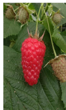
Frutto maturo di lampone