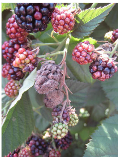
Botrite su mora

Si è ottenuto l'uso straordinario di un principio attivo per la gestione di Drosophila suzukii dal 23 giugno 2017 e al 20 ottobre 2017.