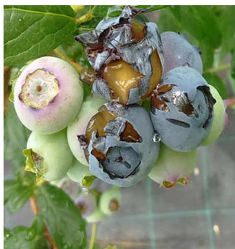
Danni causati dagli uccelli