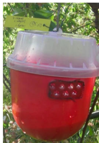
Trappola per Drosophila suzukii (Biobest)