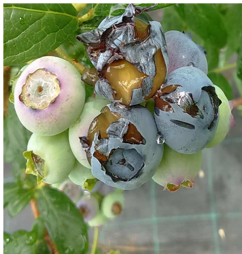
Danni causati dagli uccelli