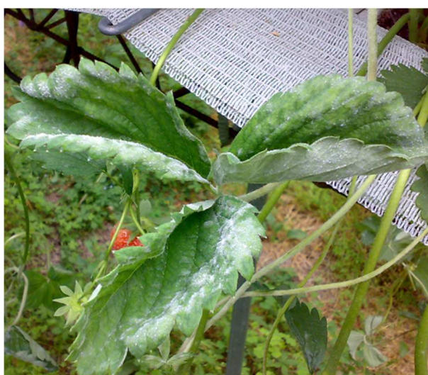
Oidio su foglie e stoloni