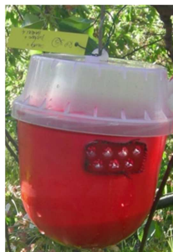
Trappola per Drosophila suzukii (Biobest)