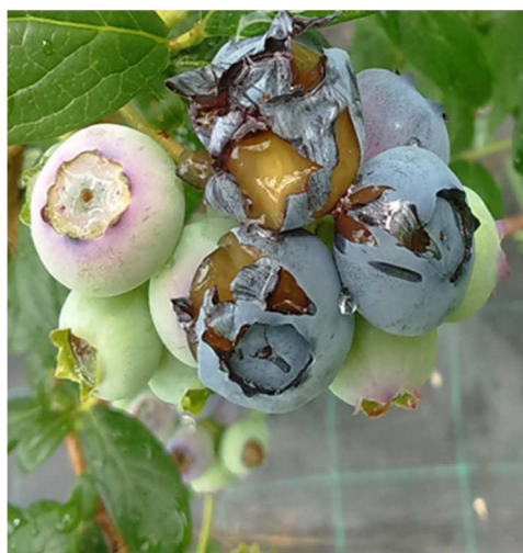
Danni causati dagli uccelli

Nei casi di Armillaria mellea o deperimento delle piante eseguire eventualmente Trichoderma harzianum rifai (ceppo T-22), preferibilmente in settembre. In post-raccolta intervenire con un prodotto rameico e verificare la presenza di scudetti di cocciniglia.