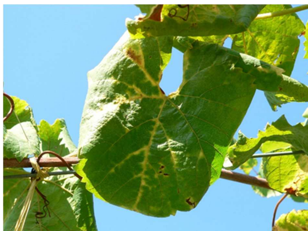
Giallume della vite

Effettuare il diserbo autunnale ove consentito prima della fine di ottobre. Effettuare eventuali sfalci autunnali dove l'erba è alta.