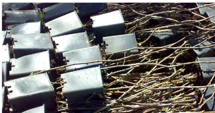
Astoni di lampone in castasta, verificare la situazione delle gemme

Controllare nei vivai lo stato delle piante e la fase fenologica delle gemme, per verificare che non vi sia un germogliamento anticipato durante la fase di fine svernamento sotto tessuto non tessuto.