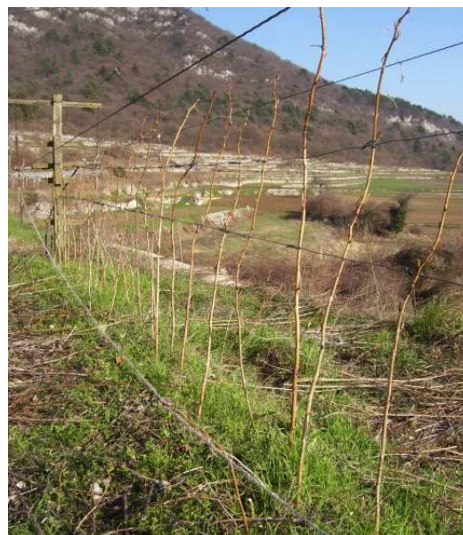
Lampone unifero dopo la potatura