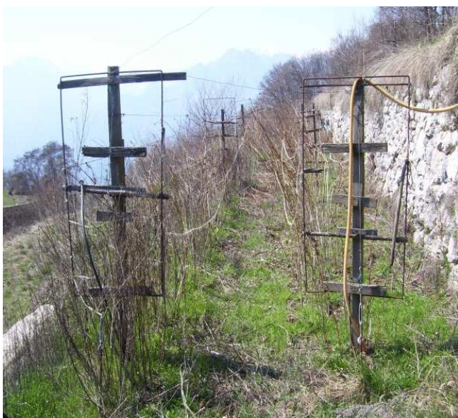
Lampone unifero prima della potatura

Potatura per diradamento e selezione tralci per la produzione.