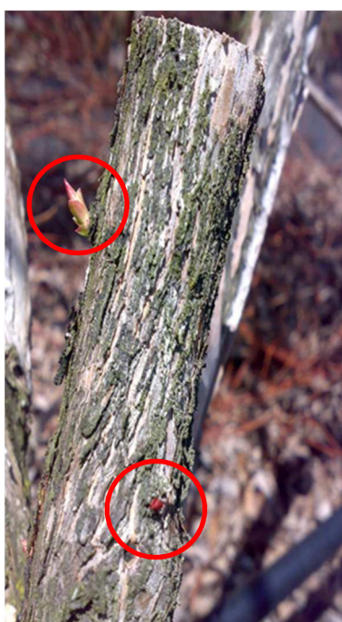
Effetto di ricaccio succhioni lasciando speroni (soprattutto per varietà Duke)