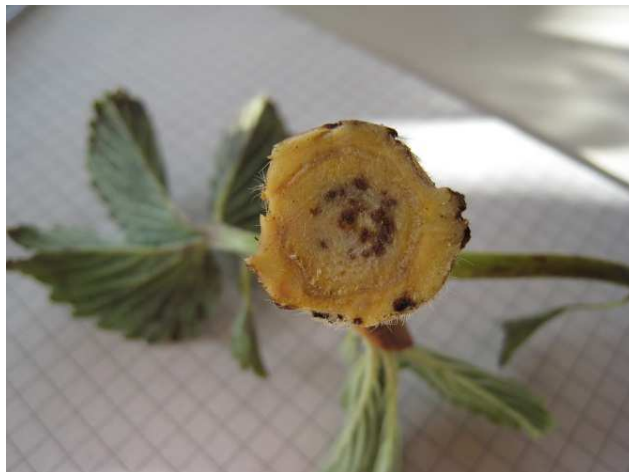
Sezionare alcune piante a campione per eventuali danni