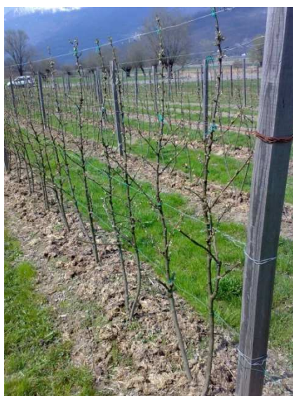
Impianto di ribes potato