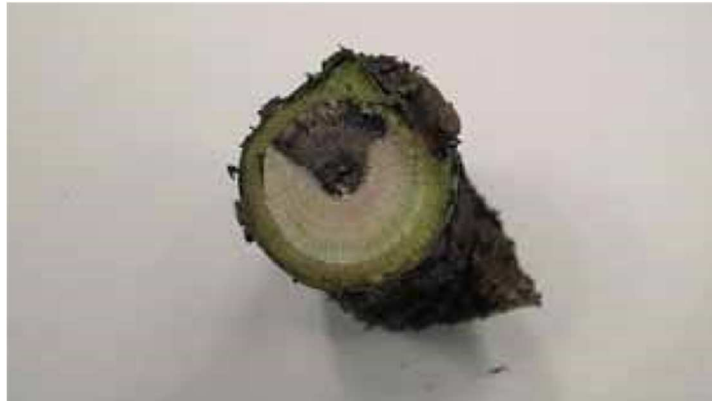
Necrosi a forma di "V" su un ramo di ribes infetto da eutipiosi