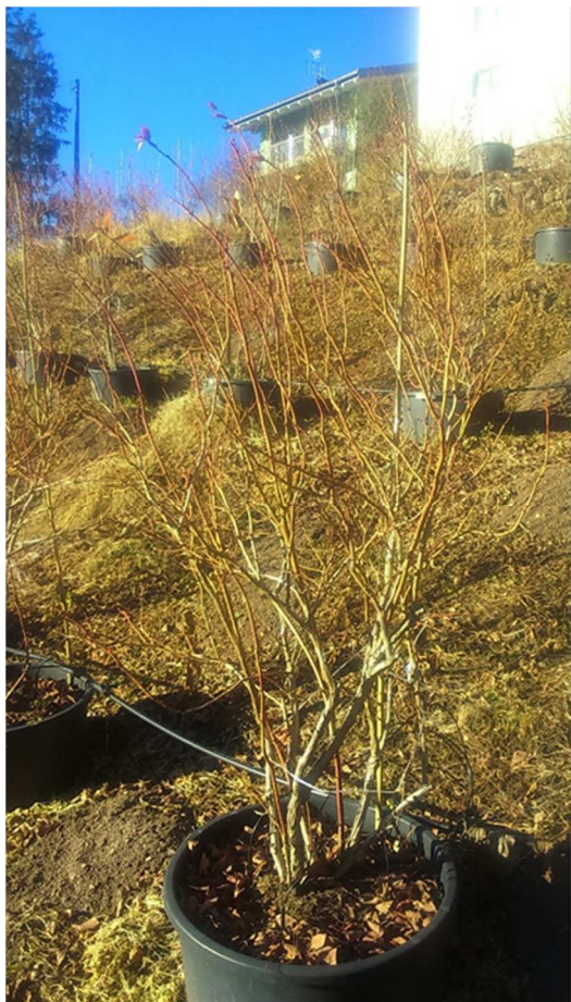
Pianta mirtillo varietà Duke prima della potatura