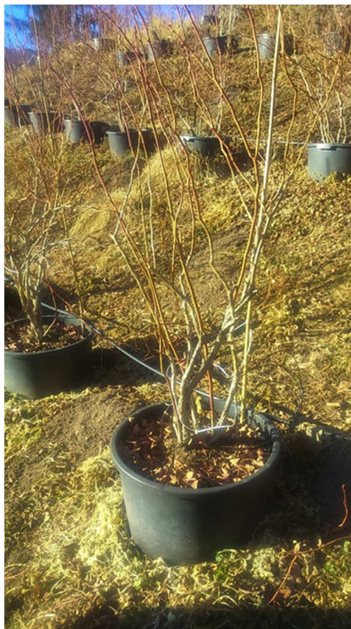
Pianta di mirtillo varietà Duke dopo la potatura