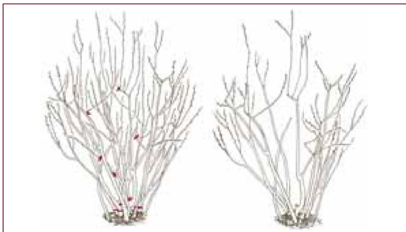
Potatura del mirtillo