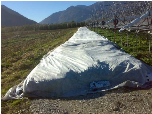
Controllare le piante di fragola svernate sotto stimare tessuto non tessuto