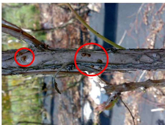
Foto di scudetti di cocciniglia