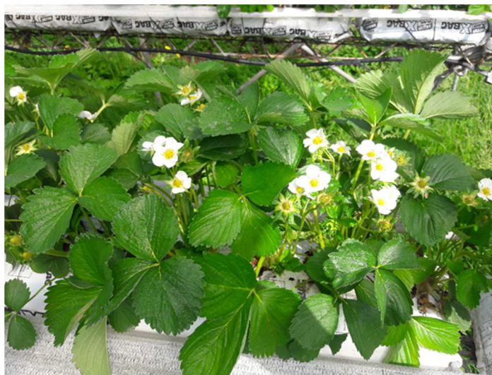
Fragole trapiantate in primavera: ingrossamento pianta ed emissione dei primi steli fiorali