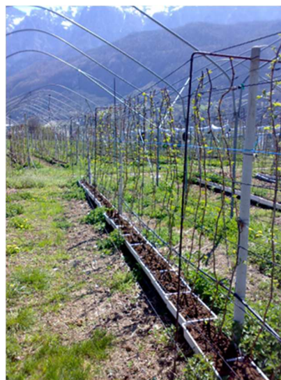
Piante di lampone fuori suolo appena esposte