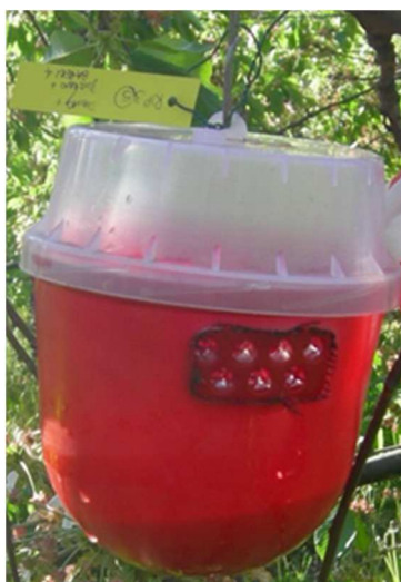
Trappola per Drosophila suzukii (Biotest)

Sostituire settimanalmente l'esca alimentare presente nelle le trappole ai margini dei boschi attorno agli impianti, anche in assenza di coltura in atto. L'esca alimentare è composta da una miscela di aceto di mela (150 ml), vino rosso (50 ml) e un cucchiaino di zucchero di canna grezzo (o Droskidrink).