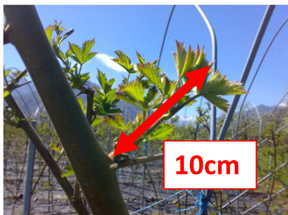
Pianta di mora: lunghezza germogli

Cominciare irrigazione e con i germogli lunghi 5 cm concimare con 40 kg/1000 mq concime complesso (12-6-18) o fertirrigazione standard (come lampone).