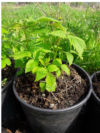
Crescita polloni di lampone rifiorente

Esporre le piante se non ancora fatto e iniziare la concimazione con la fertirrigazione standard. La fase fenologica varia in funzione dell'altitudine e della data di esposizione delle piante per lampone unifero e programmato, mentre alla fase di crescita dei polloni per lampone rifiorente per la produzione autunnale.