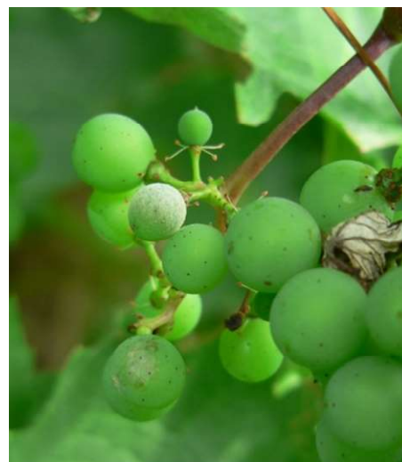
Oidio su grappolo

L' oidio è poco presente su foglie ma in aumento sui grappoli dei testimoni non trattati di collina. La difesa può essere attuata con zolfo o, in zone collinari e su varietà sensibili, con prodotti specifici.