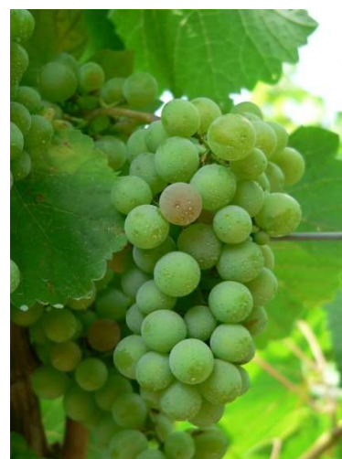
Primissimi acini invaiati

Nelle zone più precoci si possono vedere i primi acini invaiati. Al momento la stagione risulta in linea con il 2017 e quindi mediamente precoce. Allo stato attuale la produzione dell'annata si prospetta buona.