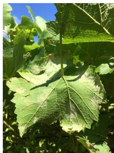
Macchie di peronospora sporulata