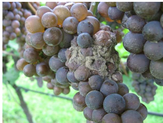
Botrite su Pinot Grigio

Eeguire in questi giorni, e comunque almeno 30 giorni prima della presunta data di vendemmia, il trattamento avendo cura di colpire i grappoli.