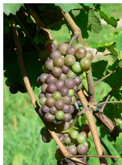
Invaiaatura Pinot Grigi

Allo stato attuale la produzione dell'annata si prospetta buona.