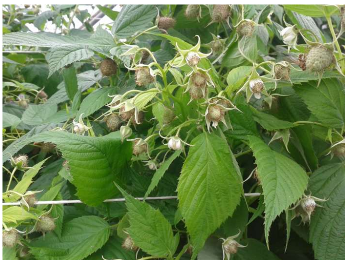
Fiori e frutti allegati di lampone

Gestire con attenzione le reti antinsetto anche nei momenti di ingresso e uscita degli operatori, non lasciare mai aperto nemmeno per poco tempo.