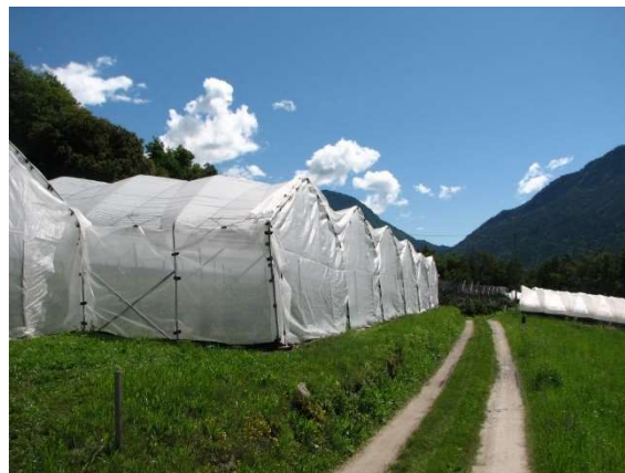
Chiusura con reti antinsetto per la difesa da Drosophila suzukii.

Gestire con attenzione le reti antinsetto anche nei momenti di ingresso e uscita degli operatori, non lasciare mai aperto nemmeno per poco tempo. Ovviamente le reti antinsetto sono utili al tempo stesso anche per evitare i danni degli uccelli sui frutti.