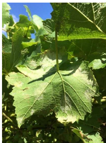
Macchie di peronospora sporulata