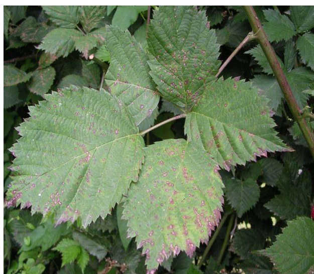
Peronospora su mora

Se non si applicano le barriere fisiche negli impianti in raccolta eseguire la cattura massale per la Drosophila suzukii con trappole rosse caricate con 200 ml Droskidrink (o miscela di 150 ml aceto mele e 50 ml vino rosso) + 4 g di zucchero di canna disponendo le trappole ogni 2 m lungo tutto il perimetro dell'impianto ad un'altezza di 1 – 1,5 m da terra. Negli impianti non in produzione esporre comunque almeno 5-10 di queste trappole per ogni 1000mq. Coloro che utilizzano le reti antinsetto possono installarle a breve con l'accorgimento di posizionare le arnie di bombi per l'impollinazione al loro interno. Monitorare l'interno del campo solo dopo la chiusura delle reti per verificare eventuali entrate accidentali, utilizzando le trappole rosse come appena descritto sopra. Gestire con attenzione le reti antinsetto anche nei momenti di ingresso e uscita degli operatori, non lasciare mai aperto nemmeno per poco tempo.