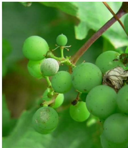
Oidio su grappolo

Il fungo in questa annata non è stato particolarmente aggressivo.