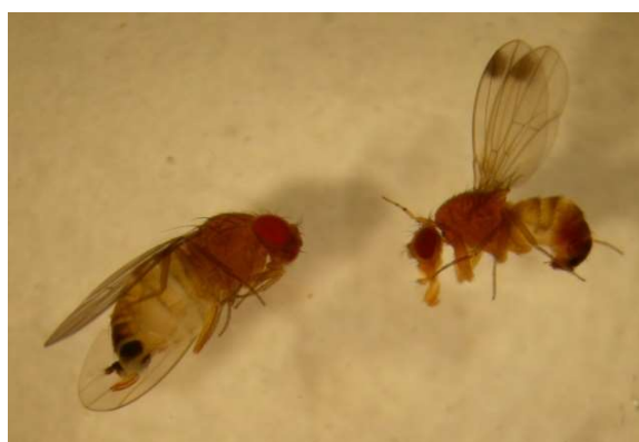
Adulti di Drosophila suzukii maschio (destra) e femmina (sinistra)

Gestire con attenzione le reti antinsetto anche nei momenti di ingresso e uscita degli operatori, non lasciare mai aperto nemmeno per poco tempo.