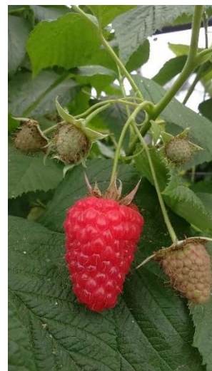
Frutto maturo di lampone