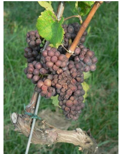
Scottature ai grappoli

In questo periodo particolarmente caldo evitare sfogliature e cimature energiche per non creare problemi di scottature ai grappoli.