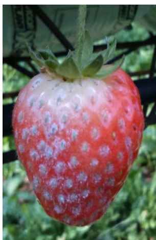
Oidio su frutti.

Ottenuto uso straordinario per Drosophila suzukii a partire dal 15 luglio 2017 e fino all'11 novembre 2017.