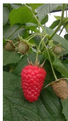
Frutto maturo di lampone