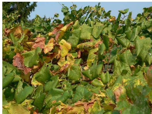
Giallumi della vite: le foglie si ripiegano a triangolo verso il basso.

Con il termine “Giallumi della vite” si identificano due malattie che mostrano gli stessi sintomi ma sono ben diverse: Legno Nero e Flavescenza Dorata.