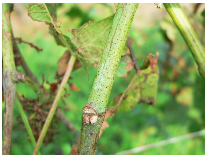
Flavescenza dorata: avvizzimento che porta al disseccamento dei grappoli; tralci che non lignificano e che presentano punteggiatura in rilievo.