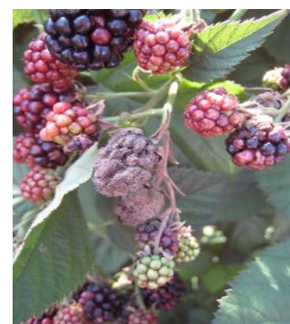
Botrite su mora