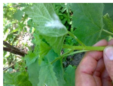
Oidio su polloni di ribes

Intervenire con un antioidico e mantenere sempre pulito da un eccessivo numero di polloni, lasciando al massimo 2-3 giovani polloni di media vigoria. Spesso proprio dai polloni iniziano le infezioni di oidio, essendo tra le parti più giovani e sensibili della pianta.