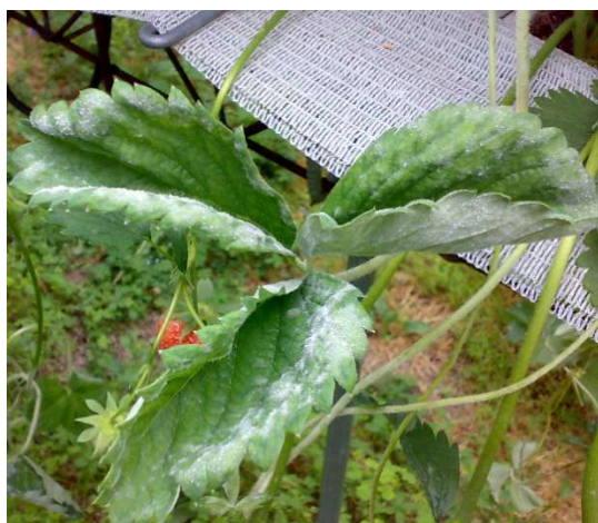
Oidio su foglie e stoloni.