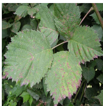
Peronospora su mora

Se non si applicano le barriere fisiche negli impianti in raccolta eseguire la cattura massale per la Drosophila suzukii con trappole rosse caricate con 200 ml Droskidrink (o miscela di 150 ml aceto mele e 50 ml vino rosso) + 4 g di zucchero di canna disponendo le trappole ogni 2 m lungo tutto il perimetro dell'impianto ad un'altezza di 1 – 1,5 m da terra. Negli impianti non in produzione esporre comunque almeno 5-10 di queste trappole per ogni 1000mq. Coloro che utilizzano le reti antinsetto possono installarle a breve con l'accorgimento di posizionare le arnie di bombi per l'impollinazione al loro interno. Monitorare l'interno del campo solo dopo la chiusura delle reti per verificare eventuali entrate accidentali, utilizzando le trappole rosse come appena descritto sopra. Gestire con attenzione le reti antinsetto anche nei momenti di ingresso e uscita degli operatori, non lasciare mai aperto nemmeno per poco tempo.