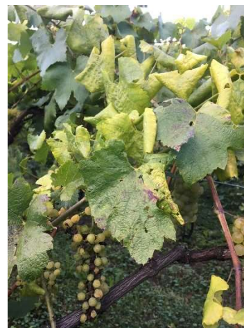
Le foglie si ripiegano a triangolo verso il basso