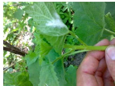
Oidio su ribes

Controllare le fasi fenologiche e la presenza di afidi. Intervenire con un antioidico e mantenere sempre pulito da un eccessivo numero di polloni, lasciando al massimo 2-3 giovani polloni di media vigoria. Spesso proprio dai polloni iniziano le infezioni di oidio, essendo tra le parti più giovani e sensibili della pianta.