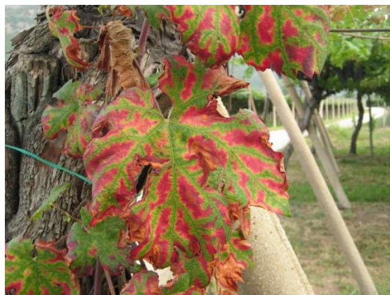
Mal dell'Esca su varietà a bacca rossa