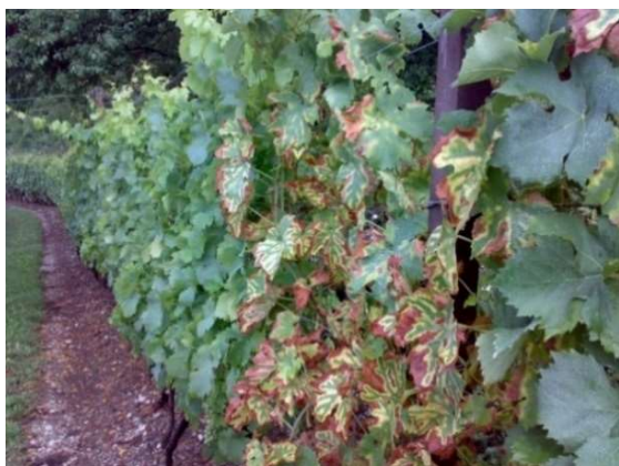
Mal dell'Esca su varietà a bacca bianca