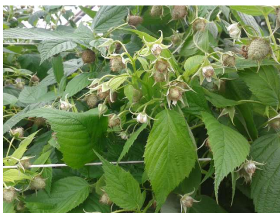
Fiori e frutti allegati di lampone

Gestire con attenzione le reti antinsetto anche nei momenti di ingresso e uscita degli operatori, non lasciare mai aperto nemmeno per poco tempo.