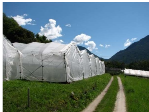
Chiusura con reti antinsetto per la difesa da Drosophila suzukii .

Gestire con attenzione le reti antinsetto anche nei momenti di ingresso e uscita degli operatori, non lasciare mai aperto nemmeno per poco tempo. Ovviamente le reti antinsetto sono utili al tempo stesso anche per evitare i danni degli uccelli sui frutti.