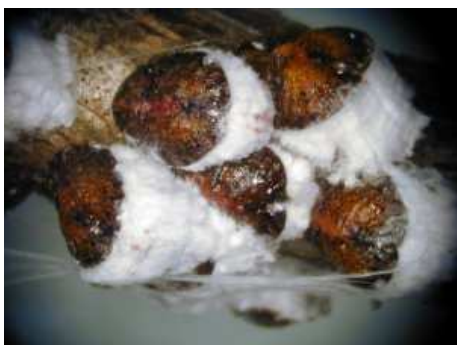
Cocciniglia ribes: pulvinaria ribesiae