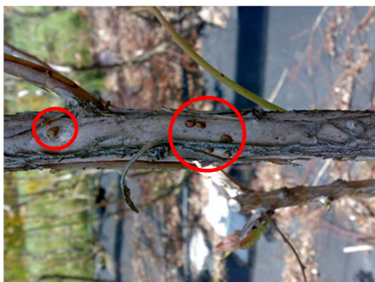
Foto di scudetti di cocciniglia