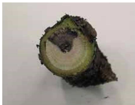
Necrosi a forma di "V" su ramo di ribes infetto da eutipiosi