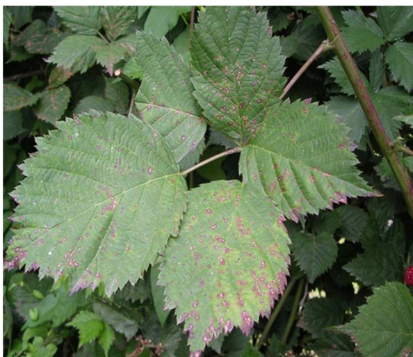
Allegagione mora Lochness

appena descritto sopra. Gestire con attenzione le reti antinsetto anche nei momenti di ingresso e uscita degli operatori, non lasciare mai aperto nemmeno per poco tempo.