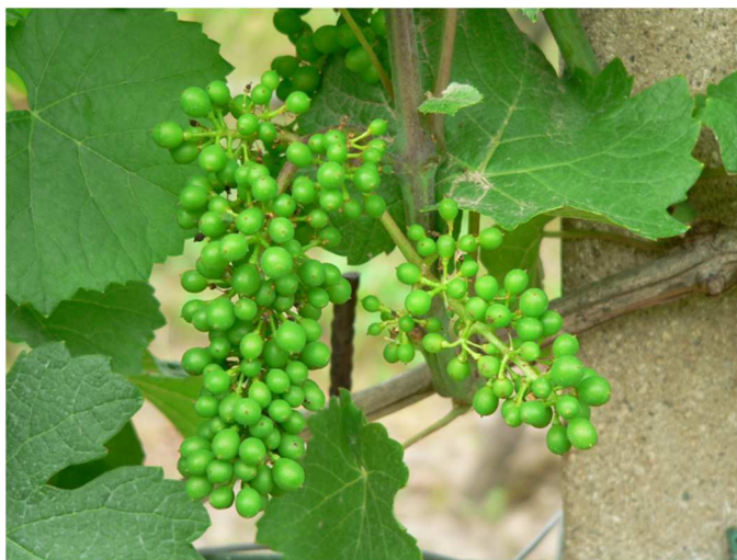
Stadio fenologico: accrescimento acini

A seconda della varietà e della zona la vite si trova allo stadio fenologico che va da pre-chiusura a chiusura grappolo, in ritardo, per via delle basse temperature di maggio, di circa 8-10 giorni rispetto al 2018.