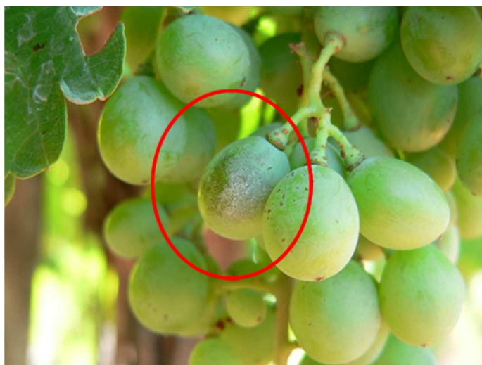
Oidio su grappolo