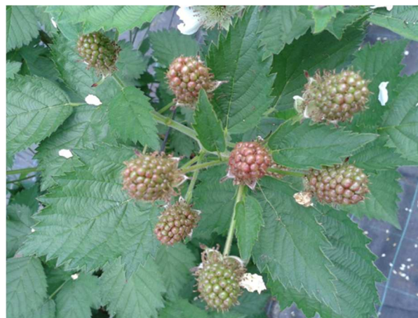
Peronospora su mora