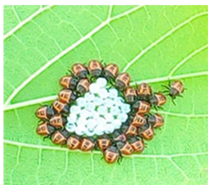
Ovatura e giovani di nuova generazione

In questi giorni, oltre alla presenza degli adulti svernanti, dai nostri controlli, abbiamo trovato le prime ovature che daranno origine alla prima generazione.