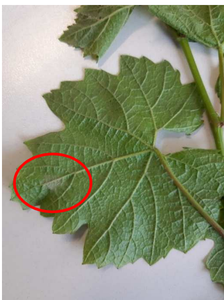
Macchia di oidio su foglia

Lo stadio fenologico sensibile e il clima caldo favoriscono lo sviluppo dell'oidio. In questo momento impiegare prodotti specifici per questo fungo soprattutto in zone collinari e su varietà sensibili. In alternativa è sempre possibile l'uso dello zolfo.