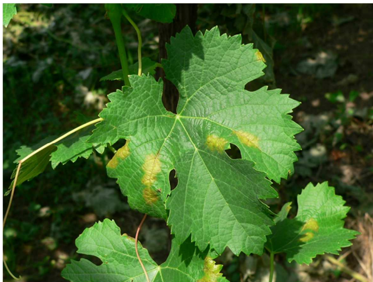
Macchie di peronospora su foglia

La situazione fitosanitaria dei vigneti è buona. Si consiglia comunque di eseguire periodicamente controlli nei propri vigneti per monitorare la situazione fitosanitaria.