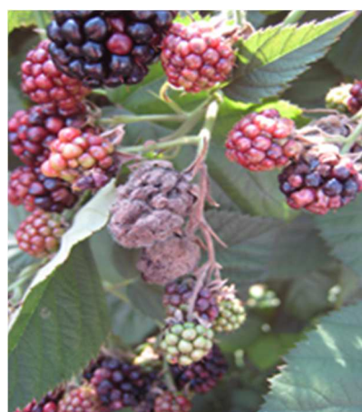
Botrite su mora