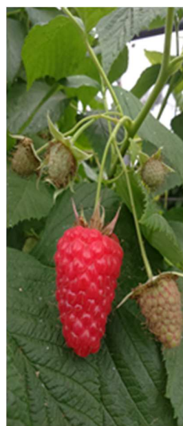
Frutto maturo di lampone