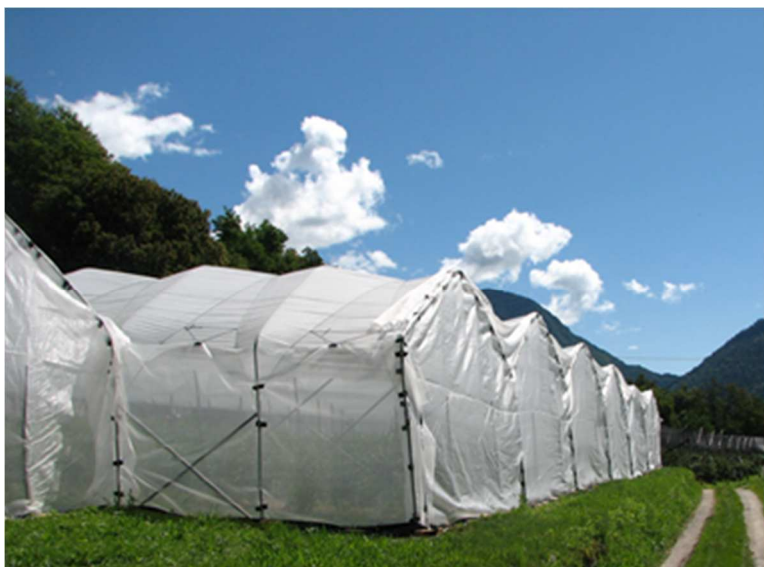
Chiusura con reti antinsetto per la difesa da Drosophila suzukii

Drosophila suzukii : se non si applicano le barriere fisiche negli impianti in raccolta eseguire la cattura massale per la Drosophila suzukii con trappole rosse caricate con 200 ml Droskidrink (o miscela di 150 ml aceto mele e 50 ml vino rosso) + 4 g di zucchero di canna disponendo le trappole ogni 2 m lungo tutto il perimetro dell'impianto ad un'altezza di 1–1,5 m da terra. Negli impianti non in produzione esporre comunque almeno 5-10 di queste trappole per ogni 1000 m 2 .