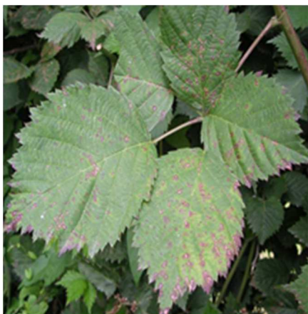
Peronospora su mora

appena descritto sopra. Gestire con attenzione le reti antinsetto anche nei momenti di ingresso e uscita degli operatori, non lasciare mai aperto nemmeno per poco tempo.