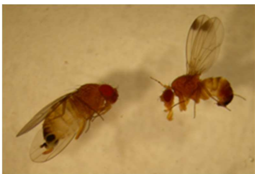
Adulti di Drosophila suzukii maschio (destra) e femmina (sinistra)

Gestire con attenzione le reti antinsetto anche nei momenti di ingresso e uscita degli operatori, non lasciare mai aperto nemmeno per poco tempo.