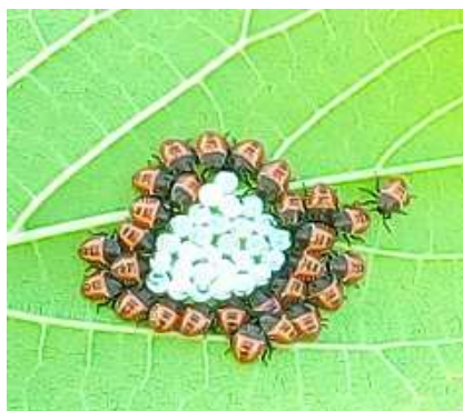
Ovatura e giovani di nuova generazione

In molti frutteti, in questo periodo, sono ben evidenti i danni su frutta dove è presente l'insetto. Da diversi giorni, dai nostri controlli, troviamo sono sia le forme giovanili che gli adulti di prima generazione.