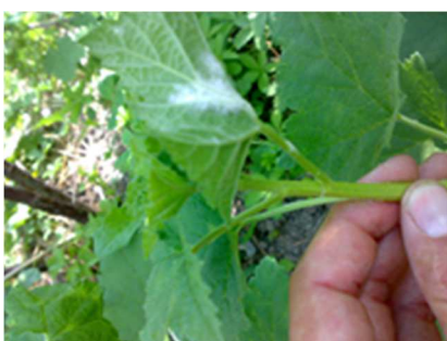
Oidio su polloni di ribes

Intervenire con un antioidico e mantenere sempre pulito da un eccessivo numero di polloni, lasciando al massimo 2-3 giovani polloni di media vigoria. Spesso proprio dai polloni iniziano le infezioni di oidio, essendo tra le parti più giovani e sensibili della pianta.