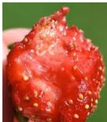
Fragola con larva di Drosophila suzukii