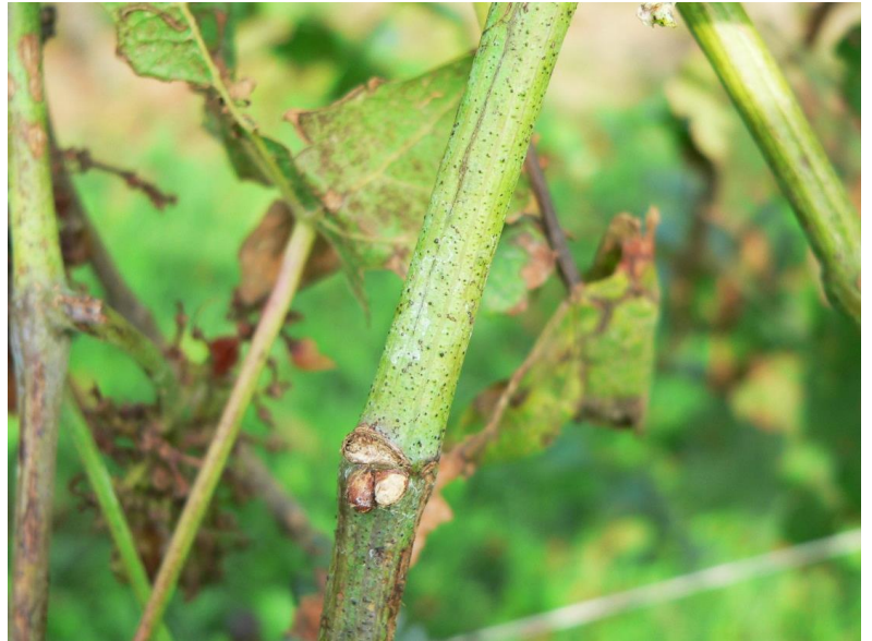
Tralci che non lignificano e che presentano punteggiatura in rilievo