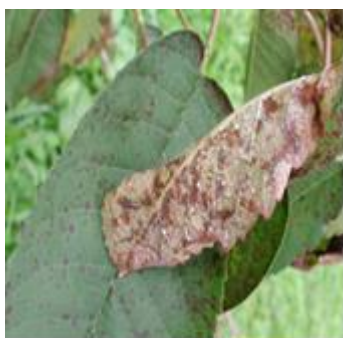
Sintomi di cilindrosporiosi su foglie di ciliegio