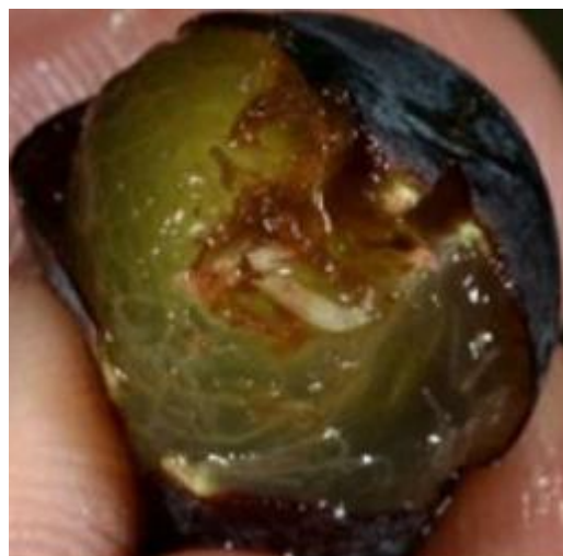
Larva di Drosophila suzukii in mirtillo