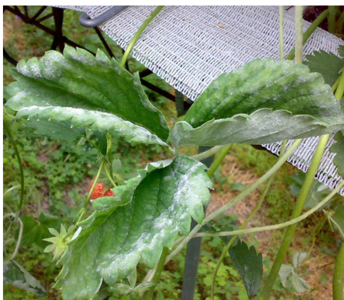
Oidio su foglie e stoloni.