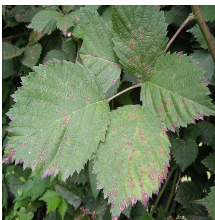
Peronospora su foglie di mora

Controllare presenza ragno rosso e l'eventuale equilibrio con i fitoseidi naturali. Si raccomanda di applicare una corretta difesa integrata per il rispetto di questi insetti, prevedendo eventualmente dei lanci di fitoseidi. Controllare la presenza di afidi, eriofidi, botrite e peronospora.