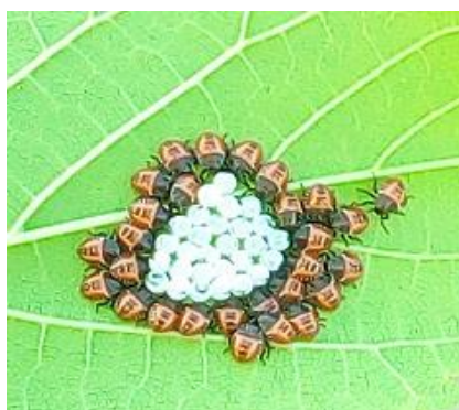
Ovatura e giovani di nuova generazione

In molti frutteti, in questo periodo, sono ben evidenti i danni su frutta dove è presente l'insetto. Da diversi giorni, dai nostri controlli, troviamo sono sia le forme giovanili che gli adulti di prima generazione.