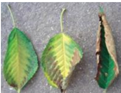
Sintomi di carenza di magnesio

Evitare attacchi di ragno rosso che causano la caduta precoce delle foglie riducendo l'accumulo di sostanze di riserva per l'anno successivo.