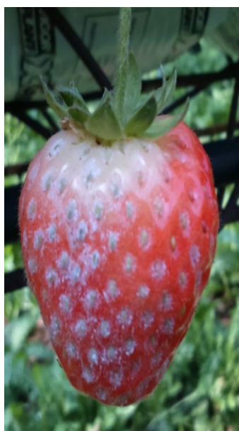
Oidio su frutti.

Drosophila suzukii : se non si applicano le barriere fisiche negli impianti in raccolta eseguire la cattura massale per la Drosophila suzukii con trappole rosse caricate con 200 ml Droskidrink (o miscela di 150 ml aceto mele e 50 ml vino rosso) + 4 g di zucchero di canna disponendo le trappole ogni 2 m lungo tutto il perimetro dell'impianto ad un'altezza di 1 – 1,5 m da terra. Negli impianti non in produzione esporre comunque almeno 5-10 di queste trappole per ogni 1000mq.