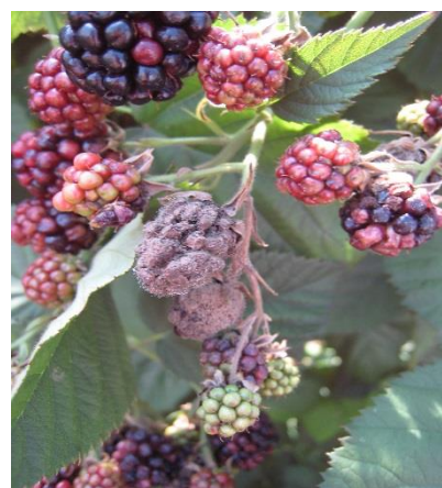
Botrite su mora

Drosophila suzukii : se non si applicano le barriere fisiche negli impianti in raccolta eseguire la cattura massale per la Drosophila suzukii con trappole rosse caricate con 200 ml Droskidrink (o miscela di 150 ml aceto mele e 50 ml vino rosso) + 4 g di zucchero di canna disponendo le trappole ogni 2 m lungo tutto il perimetro dell'impianto ad un'altezza di 1 – 1,5 m da terra. Negli impianti