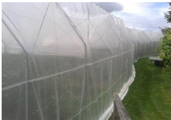
Chiusura con reti antinsetto per la difesa da Drosophila suzukii

Gestire con attenzione le reti antinsetto anche nei momenti di ingresso e uscita degli operatori, non lasciare mai aperto nemmeno per poco tempo. Ovviamente le reti antinsetto sono utili al tempo stesso anche per evitare i danni degli uccelli sui frutti.