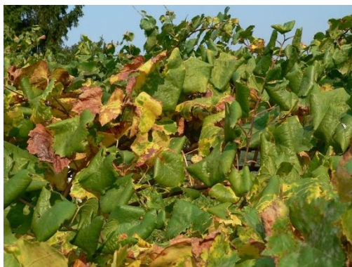
Le foglie si ripiegano a triangolo verso il basso

Risulta fondamentale estirpare tutte le viti colpite da giallumi già dal momento della comparsa dei primi sintomi.