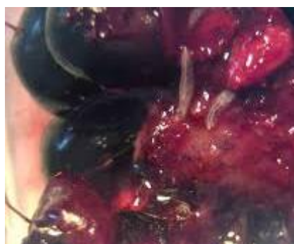
Larve di D. suzukii in frutto di mora

non in produzione esporre comunque almeno 5-10 di queste trappole per ogni 1000mq. Coloro che utilizzano le reti antinsetto possono installarle a breve con l'accorgimento di posizionare le arnie di bombi per l'impollinazione al loro interno. Monitorare l'interno del campo solo dopo la chiusura delle reti per verificare eventuali entrate accidentali, utilizzando le trappole rosse come appena descritto sopra. Gestire con attenzione le reti antinsetto anche nei momenti di ingresso e uscita degli operatori, non lasciare mai aperto nemmeno per poco tempo.