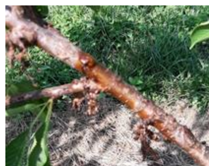
Sintomi di presenza di batteriosi su ciliegio

Eeguire concimazioni (con concimi complessi e anche qualche concimazione fogliare) per costituire le sostanze di riserva per l'anno successivo. Fare particolare attenzione a sintomi di carenza di Magnesio ed eventualmente eseguire delle concimazioni fogliari con questo elemento.