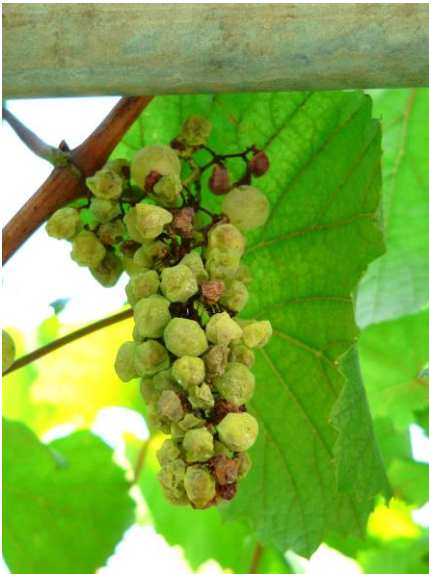
Avvizzimento che porta al disseccamento dei grappoli