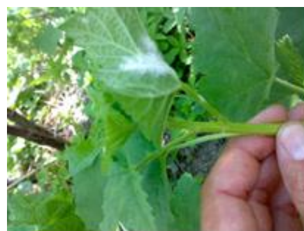
Oidio su ribes

Controllare le fasi fenologiche e la presenza di afidi. Intervenire con un antioidico e verificare la presenza di afidi.