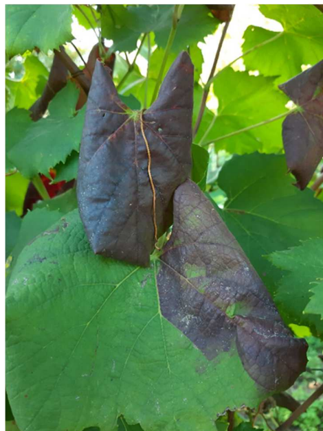
Sintomi di giallumi su foglia, Varietà bianca e varietà rossa