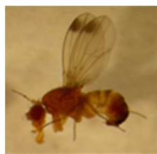
Adulti di Drosophila suzukii maschio (destra) e femmina (sinistra)