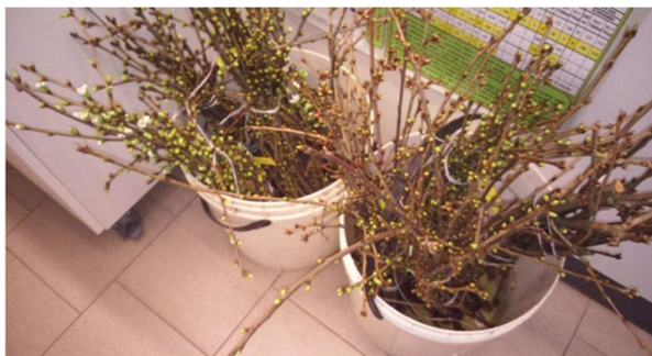
Conservazione dei rami prelevati

Si consiglia inoltre di eseguire il monitoraggio delle tignole delle gemme per valutare se prossimamente è appropriato un intervento insetticida. Il controllo si esegue prelevando alcuni rametti dalle piante, soprattutto da quelle vicine al bosco oppure dove l'anno precedente si sono riscontrati dei danni. Questi rametti raccolti vanno poi posizionati in un secchio con 15 cm di acqua e mantenuti in un ambiente interno e più caldo, per anticipare la schiusa delle gemme rispetto alla situazione di campo. Dopo 15-20 giorni allo stadio di bottoni bianchi verificare la presenza di rosure o larve all'interno degli abbozzi fiorali.