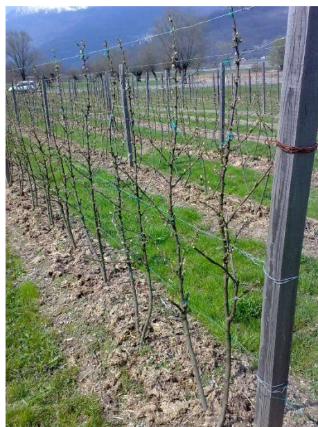
Impianto di ribes potato