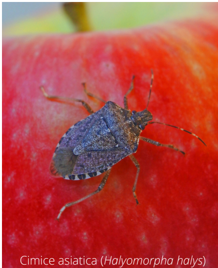
Cimice asiatica ( Halyomorpha halys )

CONTRIBUISCI ALLA PRODUZIONE DEGLI INSETTI ANTAGONISTI CHE POTRANNO COMBATTERE LA CIMICE ASIATICA