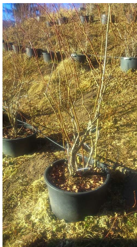
Pianta mirtillo varietà Duke dopo la potatura

Nota 1: il 6° e 7° anno è un momento critico (soprattutto per Brigitta) in cui bisogna gestire al meglio la potatura per mantenere l'equilibrio vegeto-produttivo.