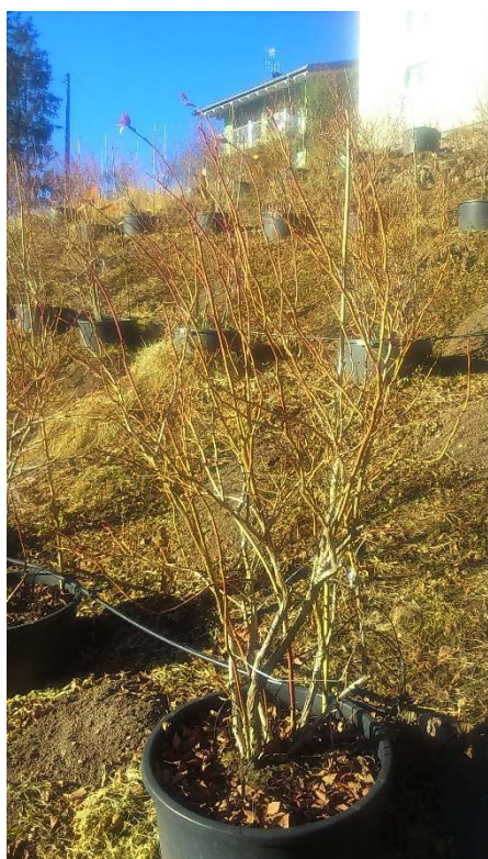
Pianta mirtillo varietà Duke prima della potatura