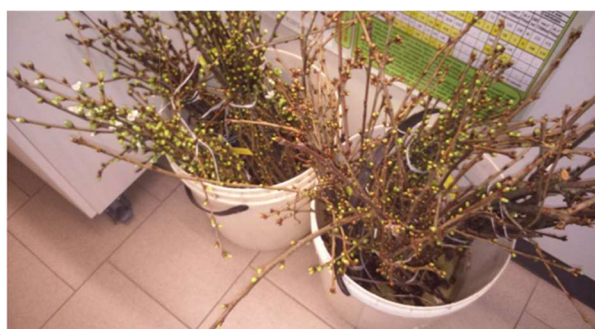
Conservazione dei rami prelevati

Si consiglia inoltre di eseguire il monitoraggio delle tignole delle gemme per valutare se prossimamente è appropriato un intervento insetticida. Il controllo si esegue prelevando alcuni rametti dalle piante, soprattutto da quelle vicine al bosco oppure dove l'anno precedente si sono riscontrati dei danni. Questi rametti raccolti vanno poi posizionati in un secchio con 15 cm di acqua e mantenuti in un ambiente interno e più caldo, per anticipare la schiusa delle gemme rispetto alla situazione di campo. Dopo 15-20 giorni allo stadio di bottoni bianchi verificare la presenza di rosure o larve all'interno degli abbozzi fiorali.