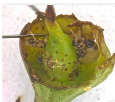
Rosure e larva nel fiore in una fase successiva