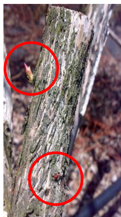
Effetto di ricaccio succhioni lasciando speroni (soprattutto per varietà Duke)

Nota 3 per Liberty, Duke, Aurora, Draper, Ozarkblue, Elliot: si ottiene una parte della produzione anche dai rami del primo anno.