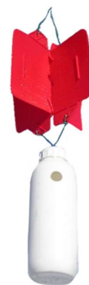
Trappola tipo REBELL ROSSO

Nei giorni scorsi, a causa dell'andamento meteo particolarmente mite, sono stati catturati i primi individui di bostrico nelle trappole di monitoraggio FEM. Con temperature massime elevate è possibile che si verifichi un volo precoce del bostrico. A partire dai prossimi giorni, posizionare le trappole per la cattura massale nei frutteti con problemi di "deperimento/moria" delle piante o in quelli in cui si è rilevata la presenza di bostrico negli anni precedenti.