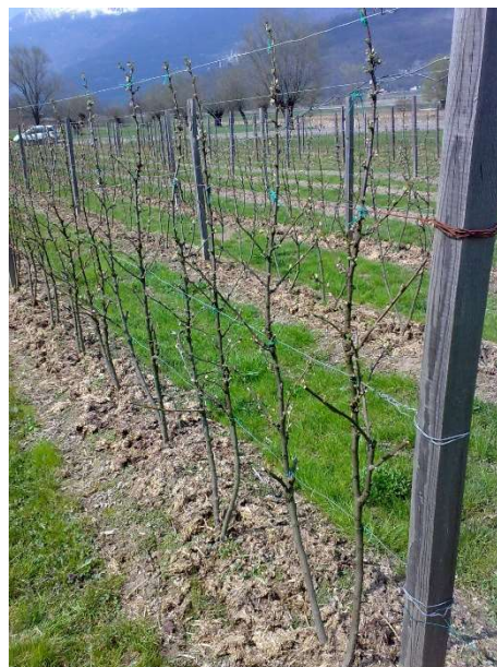
Impianto di ribes potato