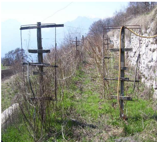
Lampone unifero prima della potatura

Potatura per diradamento e selezione tralci per la produzione.