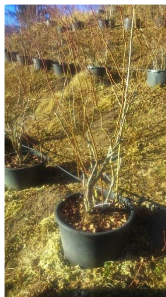
Pianta mirtillo varietà Duke dopo la potatura