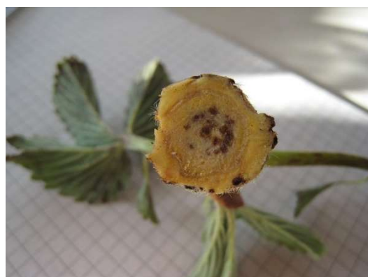
Sezionare alcune piante a campione per stimare eventuali danni