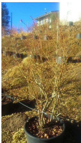
Pianta mirtillo varietà Duke prima della potatura

Nota 3 per Liberty, Duke, Aurora, Draper, Ozarkblue, Elliot: si ottiene una parte della produzione anche dai rami del primo anno.