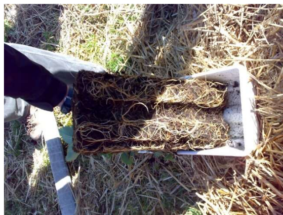
Verificare sanità delle radici di piante fragola

Nel caso di interventi con prodotti fitosanitari per la difesa utilizzare formulati autorizzati in etichetta per queste patologie e non superare le dosi massime consentite. Si raccomanda di rispettare le dosi massime ad ettaro riportate in etichetta. Trattare in giornate miti ed in assenza di vento.