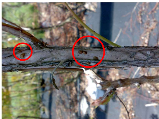
Foto di scudetti di cocciniglia

Per il contenimento di cancri rameali, necrosi e disinfezione le cicatrici dei tagli di potatura intervenire con prodotti indicati dai tecnici (con attenzione alle temperature che devono essere superiori a 12 °C). Utilizzare formulati autorizzati in etichetta per queste patologie e non superare le dosi massime consentite. Si raccomanda di rispettare le dosi massime ad ettaro riportate in etichetta. Trattare in giornate miti ed in assenza di vento.