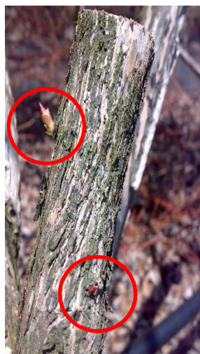
Effetto di ricaccio succhioni lasciando speroni (soprattutto per varietà Duke)