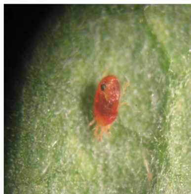
Ragno rosso (forma svernante)