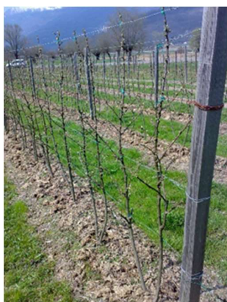
Impianto di ribes potato

Terminare potatura se non ancora terminata. Intervenire con prodotto rameico registrato sulla coltura e con olio minerale.