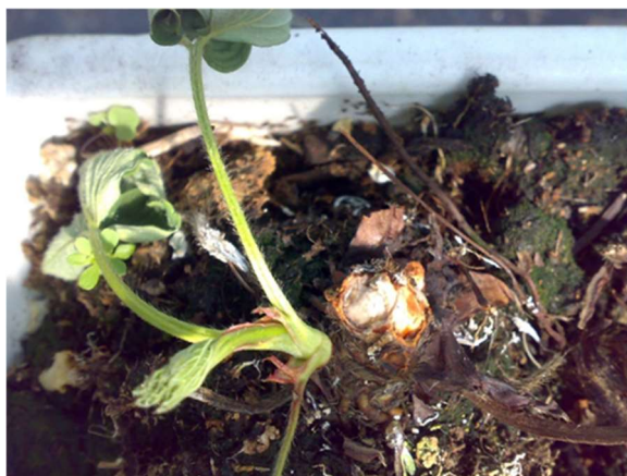
Sezionare alcune piante a campione per stimare eventuali danni