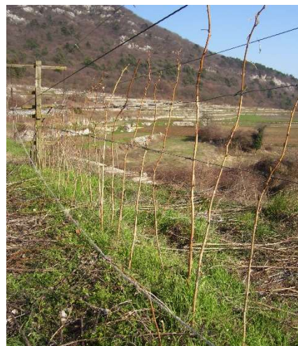
Lampone unifero dopo la potatura