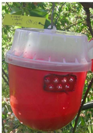
Trappola per Drosophila suzukii (Biobest)

Le nuove trappole della Biobest color rosso e caricate con una miscela di aceto di mela (150 ml), vino rosso (50 ml) e un cucchiaino di zucchero di canna grezzo (o Droskidrink) sono le più attrattive poichè catturano un maggior numero di individui di Drosophila suzukii a quelle impiegate nelle annate precedenti.