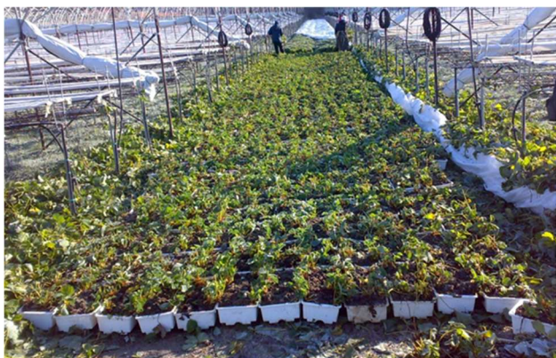
Piante di fragola appena pulite dalle foglie vecchie