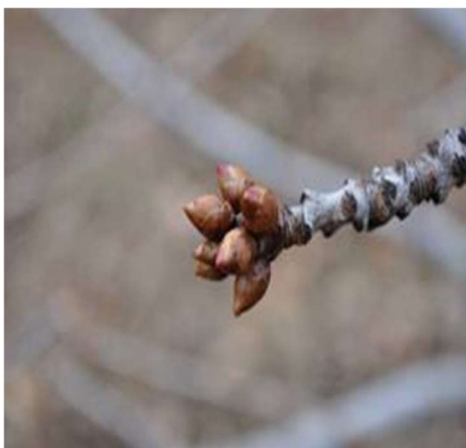
Stadio di gemme ingrossate