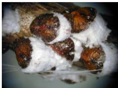
Cocciniglia ribes: pulvinaria ribesiae