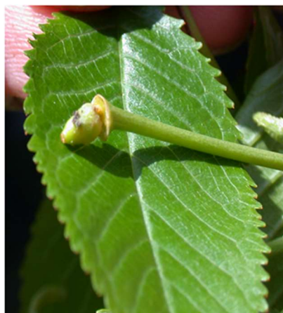
Danni da tignola delle gemme

Nel caso di possibili gelate può essere impiegato su ciliegio l'utilizzo di candele di paraffina o di stufette a pellet, metodo di difesa attiva che garantisce risultati soddisfacenti. Risulta quindi fondamentale consultare le previsioni meteo nel periodo di rischio gelate. Inoltre la massima efficacia di questo metodo si ottiene chiudendo l'impianto con telo antipioggia e rete antinsetto per trattenere il calore. Tuttavia, sulla base di alcune esperienze, l'accensione delle sole candele/stufette senza l'apertura dei teli può essere interessante soprattutto nelle prime fasi di sviluppo, quando il rischio di nevicata risulta essere più elevato.