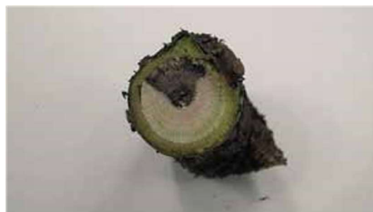
Necrosi a forma di "V" su un ramo di ribes infetto da eutipiosi