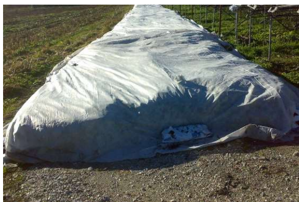
Controllare idratazione delle piante di fragola svernate sotto tessuto non tessuto

Nel caso di interventi con prodotti fitosanitari per la difesa utilizzare formulati autorizzati in etichetta per queste patologie e non superare le dosi massime consentite. Si raccomanda di rispettare le dosi massime ad ettaro riportate in etichetta. Trattare in giornate miti ed in assenza di vento.