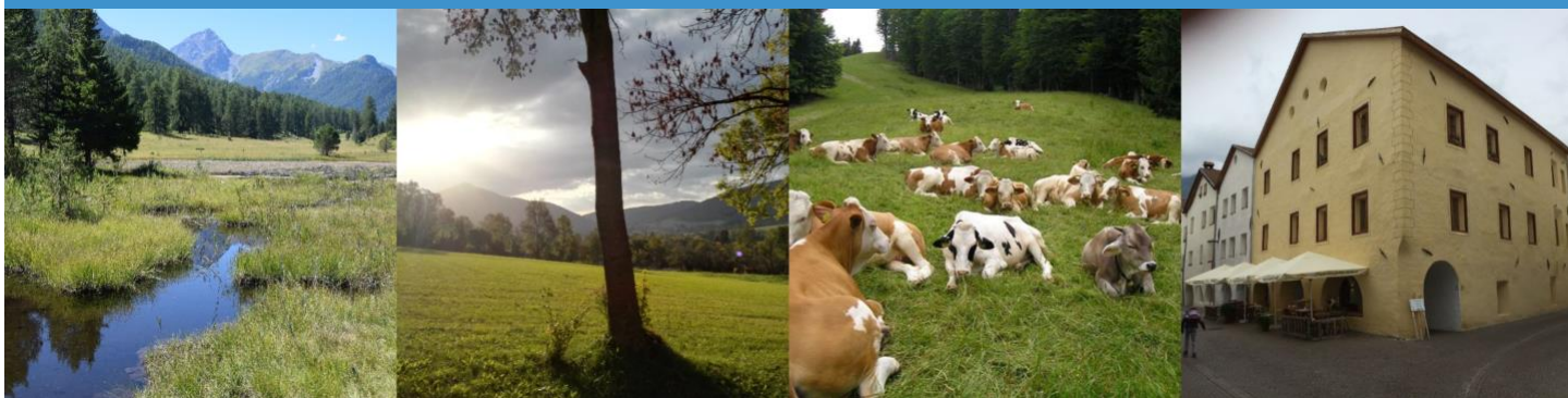
Figura 1 Aree pilota: Tarasp Lai Nair - Svizzera, Bassa Austria, Pohorje - Slovenia, Glurns - Sud Tirolo

UN USO INTELLIGENTE DEL TERRITORIO PER COMUNI SOSTENIBILI