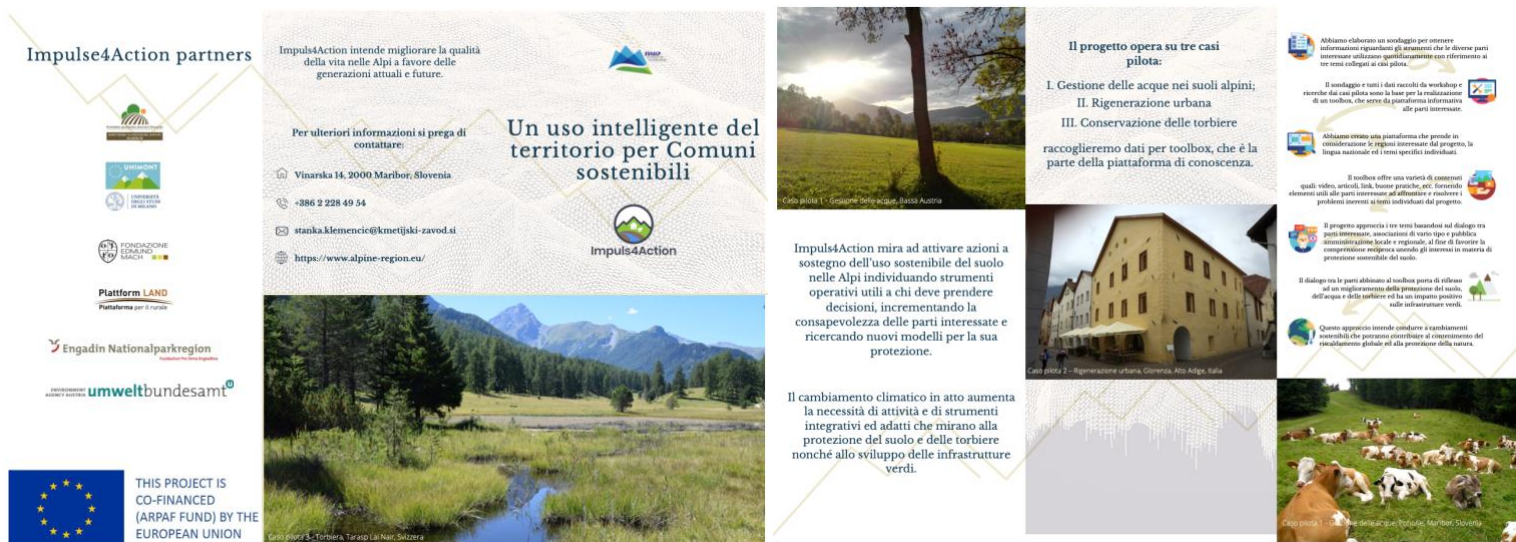
Figura 2 Brochure Impuls4Action