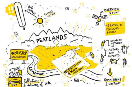
Figura 8 Cartoline Impuls4Action

* PER DESCRIZIONE, OBIETTIVI ED ALTRE INFORMAZIONI SUL PROGETTO E PER PARTECIPARE AL WEBINAR, SI PREGA DI VISITARE IL SITO UFFICIALE DELLA MACROREGIONE ALPINA EUSALP ED I SITI WEB DEL PARTNER *