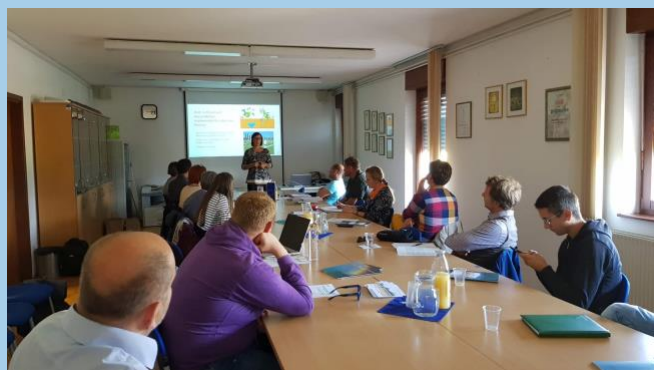
Figura 4 Centro di frutticoltura Bilje, Slovenia, 1° Seminario Gestione delle risorse idriche

Per garantire un avvio efficace ed efficiente del progetto, i partner hanno partecipato al Kick-off Meeting di Koper, in Slovenia, a settembre 2019. L'obiettivo dell'incontro era di definire una modalità di monitoraggio delle attività e la definizione dello svolgimento delle fasi successive. La seconda giornata è stata dedicata ad un tour di studio e un seminario presso il centro di frutticoltura di Bilje in cui i