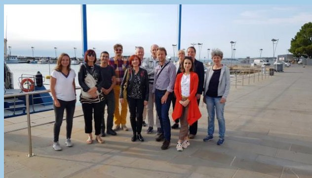
Figura 5 Koper, Slovenia, Kickoff Meeting