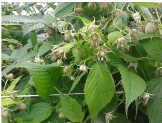
Fiori e frutti allegati di lampone

Verificare anche la presenza di fitoseidi naturali sulle foglie. Si raccomanda di applicare una corretta difesa integrata per il rispetto degli insetti utili o prevedere eventualmente dei lanci di fitoseidi. Controllare in particolare la presenza di afidi. Concimare con la fertirrigazione standard.