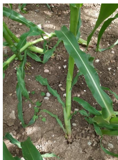
Danni da Diabrotica