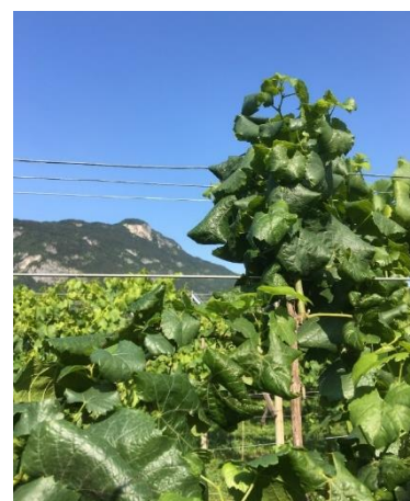
Viti con sintomi di giallumi