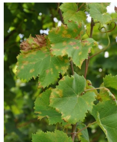
Macchie di peronospora

Quando il grappolo inizia ad invaiare non è più sensibile alla peronospora.