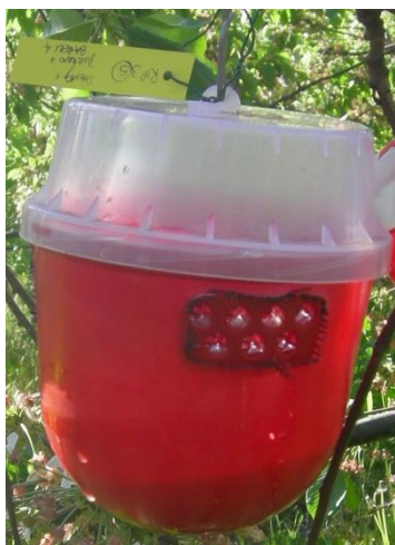
Trappola per Drosophila suzukii (Biobest)

La cattura massale è sempre molto importante, quindi sostituire settimanalmente l'esca alimentare presente nelle le trappole ai margini dei boschi attorno agli impianti, anche in assenza di coltura in atto. L'esca alimentare è composta da una miscela di aceto di mela (150 ml), vino rosso (50 ml) e un cucchiaino di zucchero di canna grezzo (o Droskidrink).