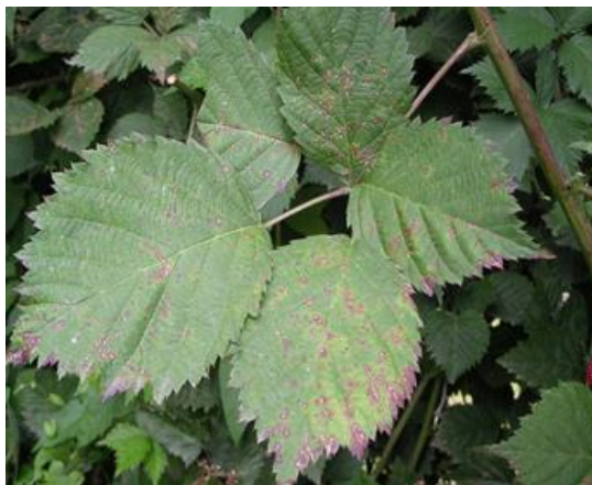
Peronospora su foglie di mora

Se non si applicano le barriere fisiche negli impianti in raccolta eseguire la cattura massale per la Drosophila suzukii con trappole rosse caricate con 200 ml Droskidrink (o miscela di 150 ml aceto mele e 50 ml vino rosso) + 4 g di zucchero di canna disponendo le trappole ogni 2 m lungo tutto il perimetro dell'impianto ad un'altezza di 1-1,5 m da terra. Negli impianti non in produzione esporre comunque almeno 5-10 di queste trappole per ogni 1000 m 2 . Coloro che utilizzano le reti antinsetto possono installarle a breve con l'accorgimento di posizionare le arnie di bombi per l'impollinazione al loro interno. Monitorare l'interno del campo solo dopo la chiusura delle reti per verificare eventuali entrate accidentali, utilizzando le trappole rosse come appena descritto sopra. Gestire con attenzione le reti antinsetto anche nei momenti di ingresso e uscita degli operatori, non lasciare mai aperto, nemmeno per poco tempo.