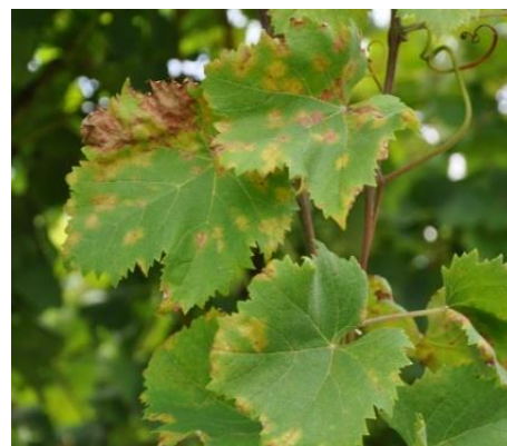
Macchie di peronospora