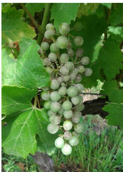
Oidio su grappolo