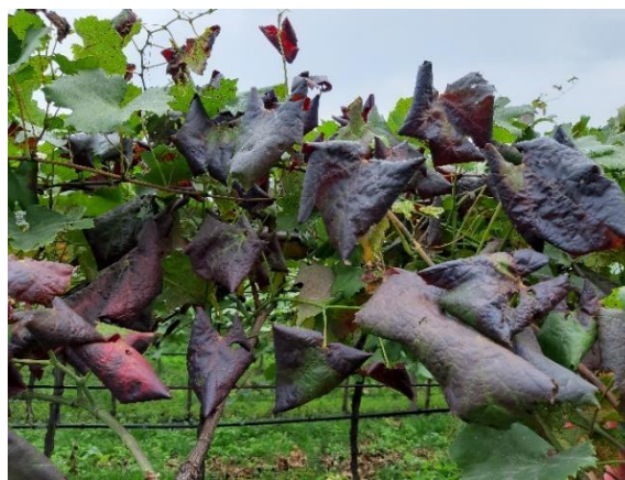
Vite con sintomi di giallumi su varietà rosse