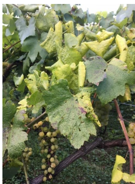
Viti con sintomi di giallumi su foglie e grappoli