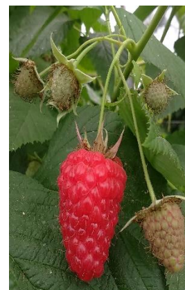
Frutto maturo di lampone

Controllare la fase fenologica, diversa in funzione dell'epoca di esposizione delle piante e dell'altitudine. Verificare anche la presenza di fitoseidi naturali sulle foglie. Si raccomanda di applicare una corretta difesa integrata per il rispetto degli insetti utili o prevedere eventualmente dei lanci di fitoseidi. Controllare in particolare la presenza di afidi. Concimare con la fertirrigazione standard.