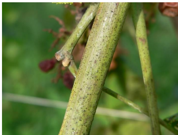
Sintomi di giallumi su tralcio