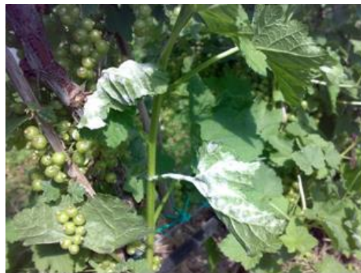
Oidio su polloni di ribes

Intervenire con un antioidico e mantenere sempre pulito da un eccessivo numero di polloni, lasciando al massimo 2-3 giovani polloni di media vigoria. Spesso proprio dai polloni iniziano le infezioni di oidio, essendo tra le parti più giovani e sensibili della pianta.