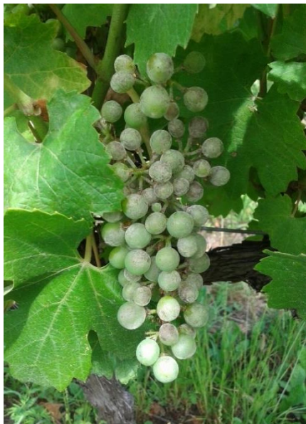
Oidio su grappolo

Si sono riscontrati in alcuni casi problemi legati a fitotossicità che non vanno confusi con oidio.