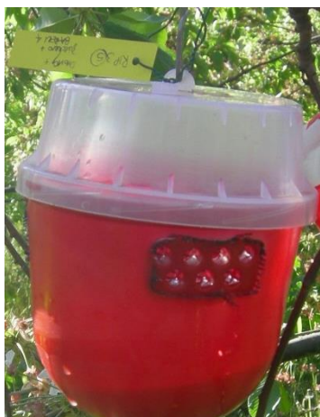
Trappola per Drosophila suzukii (Biobest)

La cattura massale è sempre molto importante, quindi sostituire settimanalmente l'esca alimentare presente nelle le trappole ai margini dei boschi attorno agli impianti, anche in assenza di coltura in atto. L'esca alimentare è composta da una miscela di aceto di mela (150 ml), vino rosso (50 ml) e un cucchiaino di zucchero di canna grezzo (o Droskidrink).