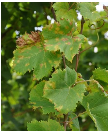
Macchie di peronospora