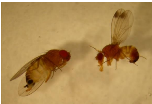
Adulti di Drosophila suzukii maschio (destra) e femmina (sinistra)

La cattura massale è sempre molto importante, quindi sostituire settimanalmente l'esca alimentare presente nelle le trappole ai margini dei boschi attorno agli impianti, anche in assenza di coltura in