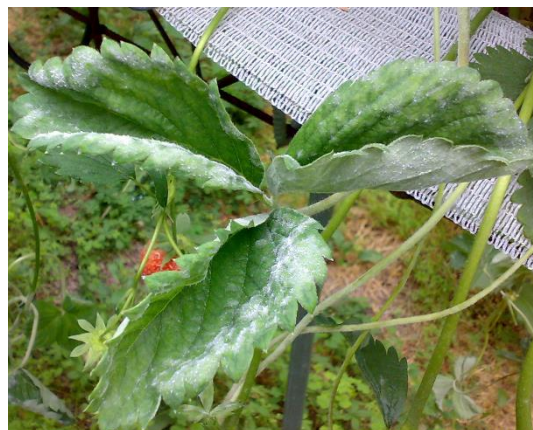
Oidio su foglie e stoloni

Fragola rifioriente: ricordarsi di eseguire di tanto in tanto il dirado delle foglie vecchie e steli fiorali raccolti e l'asportazione degli stoloni, per favorire l'arieggiamento e per contenere i danni causati da botrite. Garantire sempre una copertura della difesa antioidica cercando di alternare i prodotti in funzione del diverso meccanismo d'azione. Intercalare gli interventi con i normali prodotti di sintesi anche con qualche intervento a base di bicarbonato di potassio.