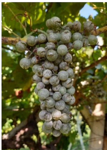
Oidio su grappolo

Solo su alcuni testimoni, nelle zone e sulle varietà più sensibili all'oidio vi sono stati grappoli colpiti in maniera importante. Nei trattati questo fungo ha generalmente causato pochi danni. Si sono riscontrati in alcuni casi problemi legati a fitotossicità che non vanno confusi con oidio.