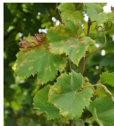
Macchie di peronospora

Si raccomanda anche nel momento della vendemmia di proseguire il monitoraggio nei propri vigneti al fine di individuare le piante sintomatiche ed estirparle tempestivamente. Si ricorda che è necessario estirpare l'intera pianta (con le radici) e non limitarsi alla sola capitozzatura (si vedano i bollettini di difesa integrata di base n. 21 del 09 giugno 2020, n. 23 del 15 giugno 2020 e n.27 del 01 luglio 2020).