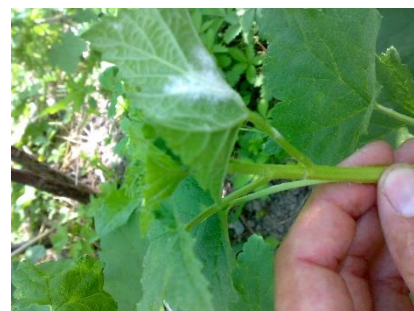
Oidio su polloni di ribes

Intervenire con un antioidico e mantenere sempre pulito da un eccessivo numero di polloni, lasciando al massimo 2-3 giovani polloni di media vigoria. Spesso proprio dai polloni iniziano le infezioni di oidio, essendo tra le parti più giovani e sensibili della pianta.