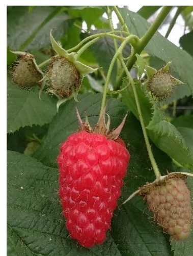
Frutto maturo di lampone

Se non si applicano le barriere fisiche negli impianti in raccolta eseguire la cattura massale per la Drosophila suzukii con trappole rosse caricate con 200 ml Droskidrink (o miscela di 150 ml aceto mele e 50 ml vino rosso) + 4 g di zucchero di canna disponendo le trappole ogni 2 m lungo tutto il perimetro dell'impianto ad un'altezza di 1-1,5 m da terra. Negli impianti non in produzione esporre comunque almeno 5-10 di queste trappole per ogni 1000 m 2 . Coloro che utilizzano le reti antinsetto possono installarle immediatamente prima dell'inizio invaiatura con l'accorgimento di posizionare al loro interno le