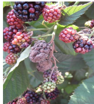
Peronospora su foglie e frutti di mora