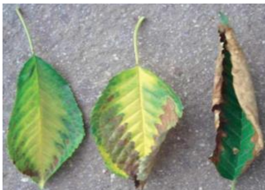
Sintomi di carenza di magnesio

Evitare attacchi di ragno rosso che causano la caduta precoce delle foglie riducendo l'accumulo di sostanze di riserva per l'anno successivo.