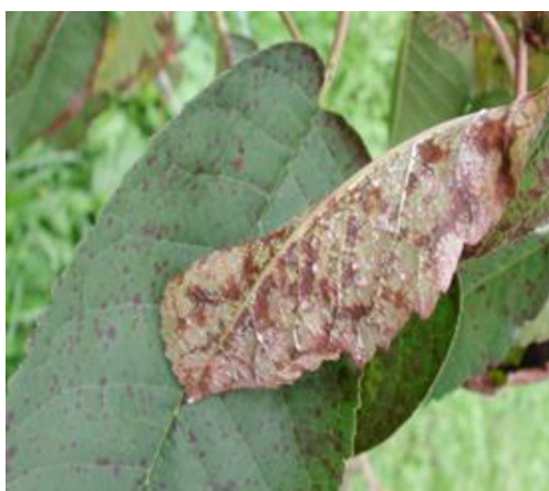
Sintomi di cilindrosporiosi su foglie di ciliegio