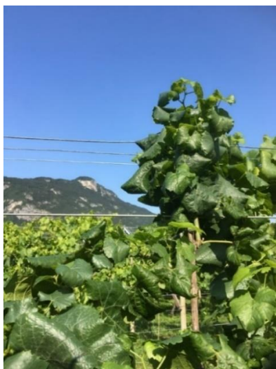
Viti con sintomi di giallumi su foglie e grappoli