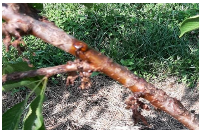
Sintomi di presenza di batteriosi su ciliegio