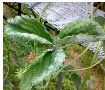
Oidio su foglie e stoloni

Intervenire con antioidico cercando di alternare i prodotti in funzione del diverso meccanismo di azione; con temperature fresche associate a un buon tasso di umidità è possibile effettuare un trattamento a base di Ampelomyces quisqualis (AQ 10 WG), fungo antagonista dell'oidio. Sono necessarie almeno 2 applicazioni a distanza di 7-10 giorni per favorire un proficuo insediamento di A. quisqualis . Possibilmente evitare le miscele con altri prodotti; in caso contrario leggere in etichetta la compatibilità con alcuni prodotti fitosanitari. In ogni caso non miscelare mai con lo zolfo e distanziare eventuali trattamenti a base di zolfo di almeno 5 giorni dall' A. quisqualis .