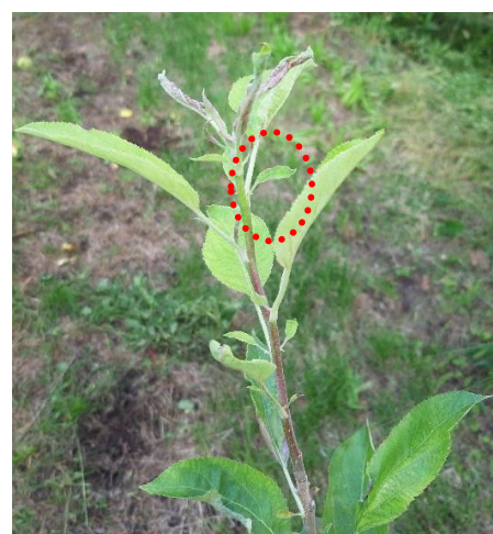
Germoglio sintomatico con stipole grandi e seghettate e vegetazione chiara

Si sta svolgendo il monitoraggio ufficiale, i controlli saranno effettuati a campione da parte di tecnici incaricati e le piante sintomatiche verranno segnate con colore verde e successivamente dovranno essere estirpate dal proprietario.