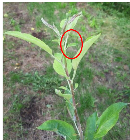
Germoglio sintomatico con stipole grandi e seghettate e vegetazione chiara

Il periodo della raccolta è un momento importante per osservare la presenza di piante che manifestano i sintomi degli scopazzi. È fondamentale segnare queste piante per procedere al loro estirpo entro l'autunno, eliminando accuratamente anche l'apparato radicale. In questa stagione i sintomi, qualora presenti, sono le stipole grandi e seghettate, le scope sulle cacciate annuali, decolorazione della vegetazione e frutti piccoli e verdi. Si sta svolgendo il monitoraggio ufficiale e i controlli saranno effettuati a campione da parte di tecnici APOT incaricati; le piante sintomatiche verranno segnate con colore verde e successivamente dovranno essere estirpate dal proprietario (come previsto dalla Delibera della Giunta Provinciale n. 1545 del 28 luglio 2006).