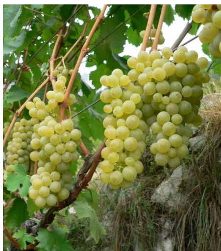
Varietà Müller Thurgau

In questi giorni si stanno raccogliendo le varietà più tardive e si è quasi giunti alla conclusione della vendemmia 2020. La qualità e la quantità raccolte sono state buone, in alcuni casi si sono avuti problemi di marciumi dovuti alle piogge dell'ultimo periodo e un clima caldo – umido.