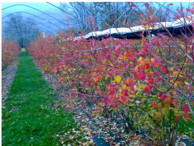
Caduta foglie e colorazione autunnale

L'impiego folgiare di urea e di solfato di potassio in autunno permette invece di reintegrare le riserve