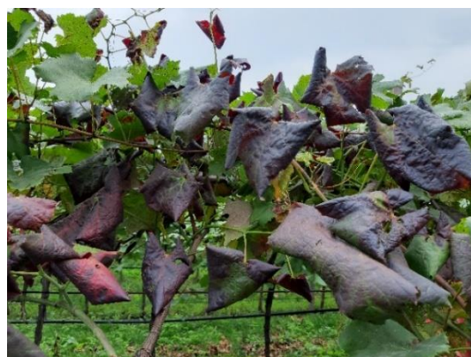
Vite con sintomi di giallumi su varietà rosse