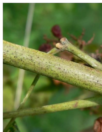
Viti con sintomi di giallumi su foglie e grappoli