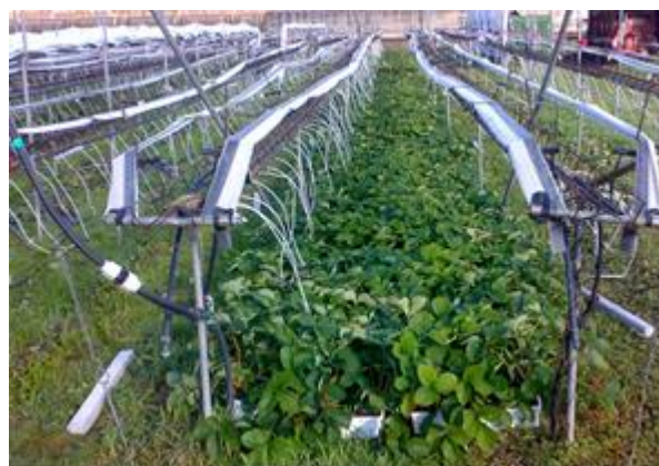
Fragole posizionate a terra

Nel caso di presenza di oziorrinco durante la stagione prevedere l'impiego di nematodi entomopatogeni (quest'anno è stato rilevato un anticipo nel ciclo dell'oziorrinco): Steinernema kraussei può essere utilizzato con una temperatura media giornaliera del suolo-substrato di 5 - 6° C. Non utilizzare con luce solare diretta. I nematodi sono inoltre sensibili a diversi fitofarmaci. Al momento sono gli unici nematodi impiegabili con le temperature attuali e prossime, è comunque auspicabile avere già eseguito interventi con Heterorhabditis megidis a fine settembre e ottobre come consigliato.