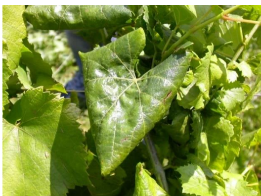
Vite con sintomi di giallumi su varietà