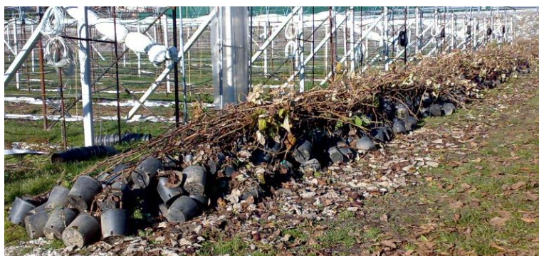
Cumulo di piante di lampone da svernare, da coprire con tessuto non tessuto alle prime gelate e successivamente anche con paglia

Nel caso in cui si sia intenzionati a conservare le piante, provvedere allo svernamento delle stesse in aiuole o in cumuli protetti alle prime gelate coprendo con tessuto non tessuto (TNT 30 g/m 2 ).