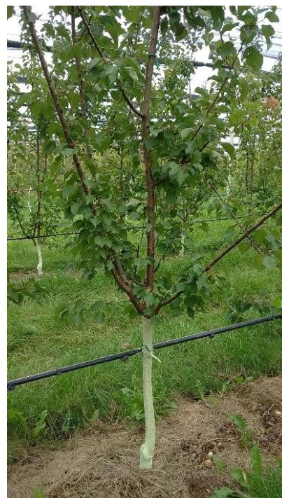
Imbiancamento fusti (esempio su albicocco)

I trattamenti rameici autunnali hanno una grande importanza per la prevenzione ed il controllo di malattie fungine e batteriche specialmente con clima umido e piovoso. È quindi consigliabile eseguire una serie di interventi con prodotti a base di rame metallo, preferibilmente con poltiglia bordolese che ha una maggior persistenza (rispettare la dose massima ammessa di rame a ettaro e nel tempo). Con precipitazioni superiori a 50-60 mm ripetere il trattamento. Intervenire con temperature non inferiori ai 10°C, su piante asciutte ed in assenza di vento. Questi trattamenti vanno eseguiti anche su impianti giovani di 1-3 anni. Eseguire l'imbiancamento del fusto che ha lo scopo di ridurre gli sbalzi termici dei tessuti corticali dovuti all'esposizione al sole nei mesi invernali prevenendo così la formazione di spaccature sulla corteccia che spesso costituiscono la via d'accesso ad agenti patogeni. Questa pratica, insieme ad una serie di misure, quali la potatura estiva ed i trattamenti rameici autunnali e primaverili, ha una certa efficacia nel limitare i danni provocati da infezioni batteriche. Si consiglia pertanto di imbiancare i fusti dei giovani impianti fino al 5° anno di età e fino ad un'altezza corrispondente