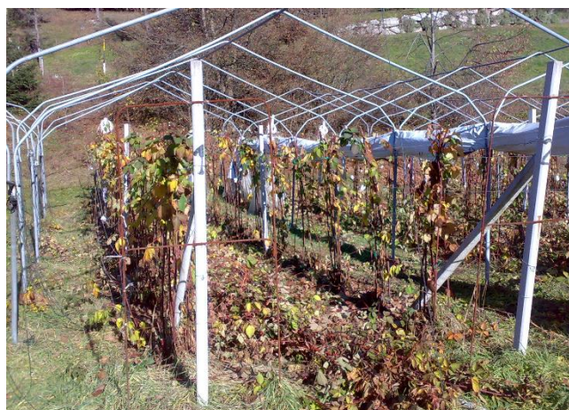
Polloni di mora legati a fasci dopo il taglio dei tralci che hanno prodotto (ancora da allontanare)

È consigliabile legare in fasci i polloni vicini per ridurre i danni invernali (es. neve). Successivamente intervenire con un prodotto rameico e con uno a base di zolfo facendo attenzione alle temperature giornaliere e notturne. Si ricorda che la dose massima ammessa di rame è di 6 kg/ha/anno inteso come rame metallo.