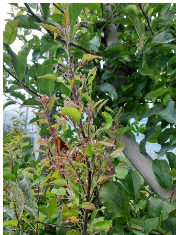
Scopa su cacciata annuale