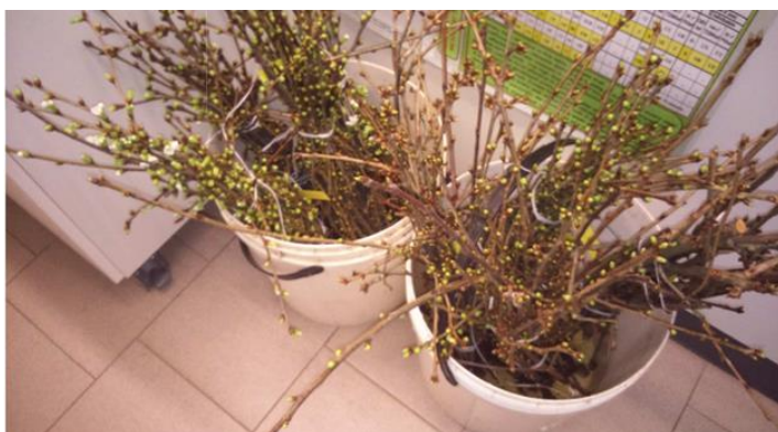
Conservazione dei rami prelevati

Si consiglia di eseguire il monitoraggio delle tignole delle gemme per valutare se prossimamente è appropriato un intervento insetticida. Il controllo si esegue prelevando alcuni rametti dalle piante, soprattutto da quelle vicine al bosco oppure dove l'anno precedente si sono riscontrati dei danni. Questi rametti raccolti vanno poi posizionati in un secchio con 15 cm di acqua e mantenuti in un ambiente interno e più caldo, per anticipare la schiusa delle gemme rispetto alla situazione di campo. Dopo 15-20 giorni allo stadio di bottoni bianchi verificare la presenza di rosure o larve all'interno degli abbozzi fiorali.