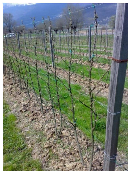
Impianto di ribes potato