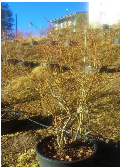
Pianta mirtillo varietà Duke prima della potatura

Per Liberty, Duke, Aurora, Draper, Ozarkblue, Elliot: si ottiene una parte della produzione anche dai rami del primo anno.