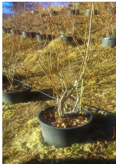
Pianta mirtillo varietà Duke dopo la potatura