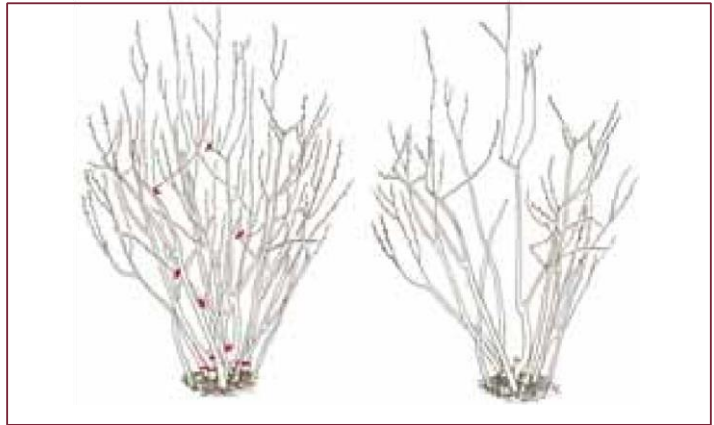
Potatura del mirtillo

Il 6° e 7° anno è un momento critico (soprattutto per Brigitta) in cui bisogna gestire al meglio la potatura per mantenere l'equilibrio vegeto-produttivo. Evitare di legare la pianta, ma lasciare la forma a cespuglio per favorire l'entrata della luce e impedire la filatura delle piante (eventuali sostegni laterali solo durante la raccolta per facilitare il passaggio).