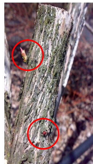
Effetto di ricaccio succhioni lasciando speroni (soprattutto per var. Duke)