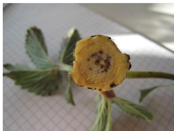
Sezionare alcune piante a campione per stimare eventuali danni

Scoprire il telo non telo nelle ore più calde del pomeriggio per favorire l'arieggiamento delle piante soprattutto dove si notano muffe e marciumi. La sera è importante il riposizionamento del telo non telo sulle piante.