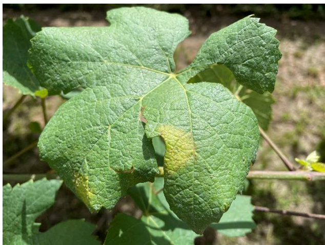
Peronospora su foglia