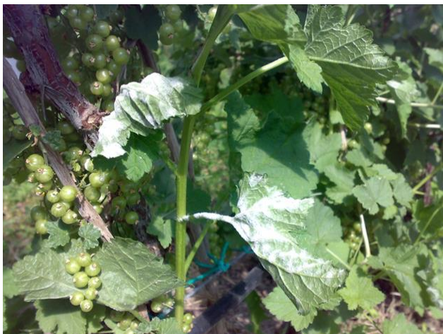
Oidio su polloni di ribes

Se non sono stati posizionati i diffusori per la confusione sessuale della Sesia, prevedere un intervento al primo volo.