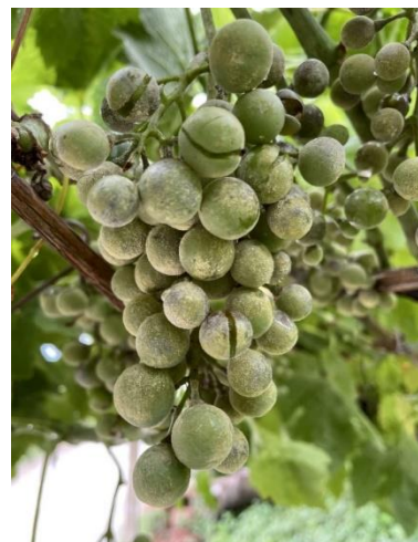
Oidio su grappolo