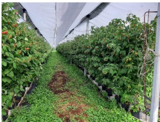
Maturazione e raccolta del lampone

Concimare con la fertirrigazione standard e verificare costantemente la gestione dell'irrigazione e del drenaggio.