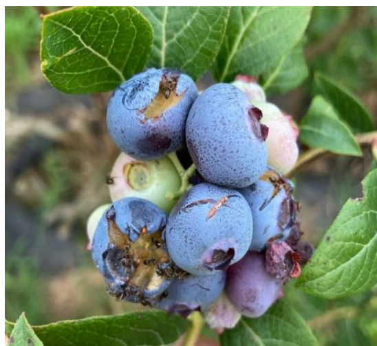
Danni causati da uccelli

In alcuni impianti è già stata rilevata una sensibile presenza di afide, sia nero che verde, sugli apici dei germogli e sulle foglie. Uno sviluppo eccessivo di queste colonie potrebbe bloccare l'accrescimento dei germogli stessi. Pertanto, si consiglia di eseguire un controllo in campo per verificare la presenza di eventuali afidi.