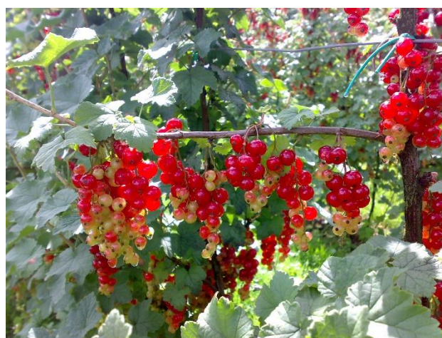
Maturazione del ribes