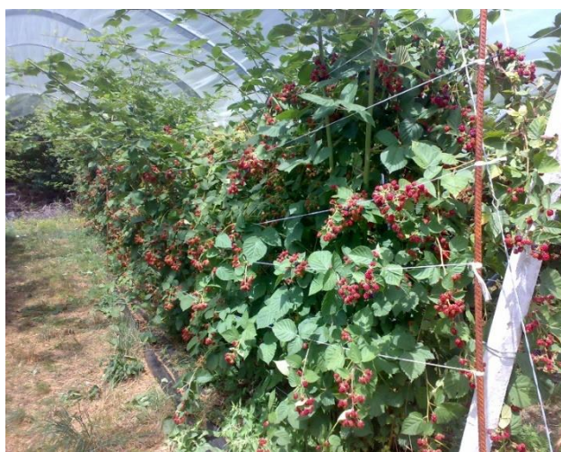
Fruttificazione e inizio maturazione della mora