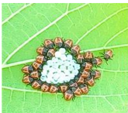
Ovatura e giovani di nuova generazione

Per informazioni sulla campagna di raccolta consultare il sito https://lottabiologica.fmach.it/