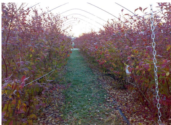
Impianto di mirtillo in autunno

Prevedere per la prossima settimana un intervento fogliare con un prodotto rameico in miscela con urea e solfato di potassio. Questo consente di reintegrare le riserve di azoto e potassio della pianta per favorire una migliore ripresa vegetativa nella successiva primavera, favorendo una più veloce decomposizione e caduta delle foglie. Inoltre, è importante per la prevenzione di malattie fungine e cancri rameali.