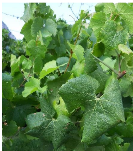
Sintomi di fitoplasmosi su varietà Chardonnay