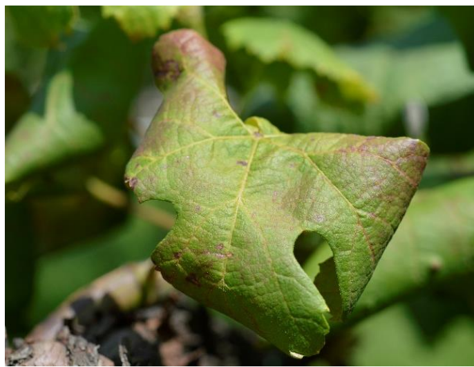
Sintomi di fitoplasmosi su varietà Teroldego