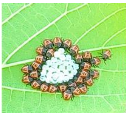
Ovatura e giovani di nuova generazione

Per informazioni sulla campagna di raccolta consultare il sito https://lottabiologica.fmach.it/