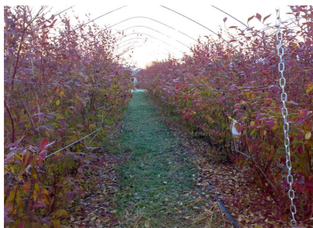
Impianto di mirtillo in autunno

Prevedere per la prossima settimana un intervento fogliare con un prodotto rameico in miscela con urea e solfato di potassio. Questo consente di reintegrare le riserve di azoto e potassio della pianta per favorire una migliore ripresa vegetativa nella successiva primavera, favorendo una più veloce decomposizione e caduta delle foglie. Inoltre, è importante per la prevenzione di malattie fungine e cancri rameali.