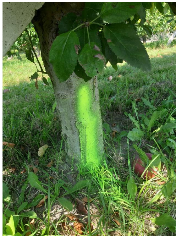
Scopazzi: pianta sintomatica segnata alla base con vernice gialla