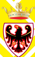
con il patrocinio della PROVINCIA AUTONOMA DI TRENTO