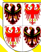
con il patrocinio della PRESIDENZA DEL CONSIGLIO REGIONALE