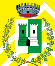
COMUNE DI CASTELNUOVO