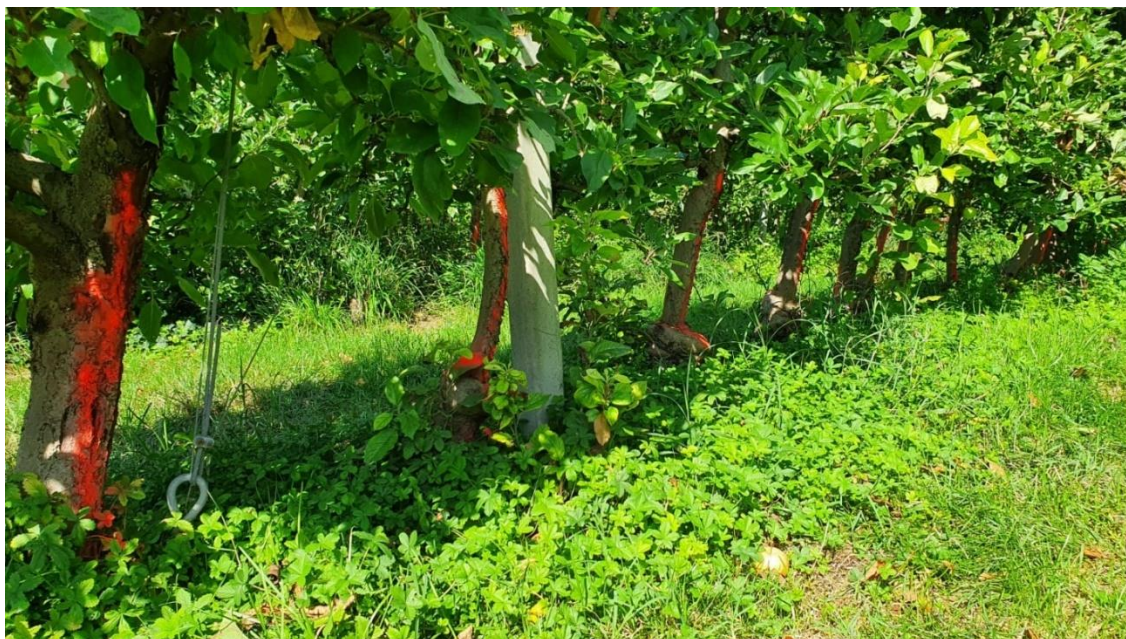
Piante sintomatiche segnate alla base con vernice ROSSA