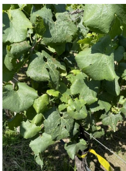
Sintomi precoci fitoplasmosi