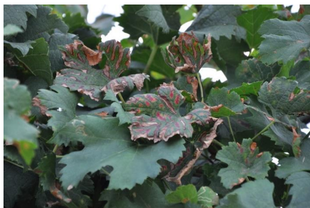
Sintomi di Mal dell'esca su varietà bianche (sx) e varietà rosse (dx)