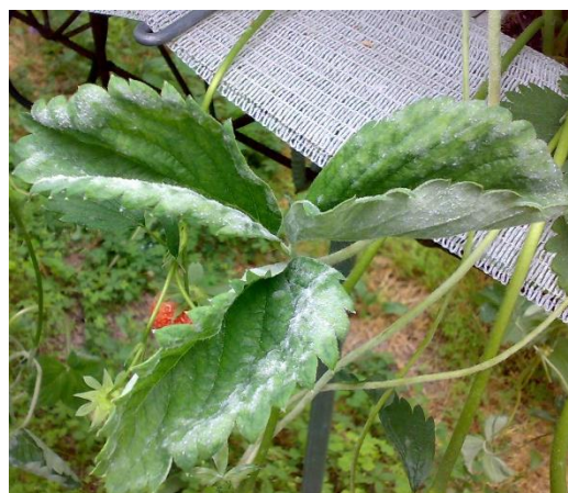
Oidio su foglie e stoloni

Intervenire con antioidico cercando di alternare i prodotti in funzione del diverso meccanismo di azione. Con temperature fresche associate a un buon tasso di umidità è possibile effettuare un trattamento a base di Ampelomyces quisqualis (AQ 10 WG), fungo antagonista dell'oidio. Sono necessarie almeno 2 applicazioni a distanza di 7-10 giorni per favorire un proficuo insediamento di A. quisqualis . Possibilmente bisogna evitare le miscele con altri prodotti; in caso