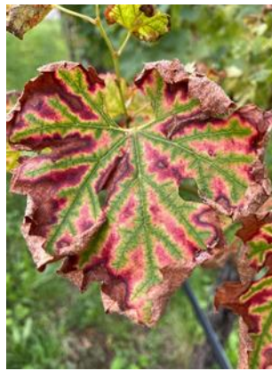
Sintomi di Mal dell'esca su varietà bianche (sx) e varietà rosse (dx)