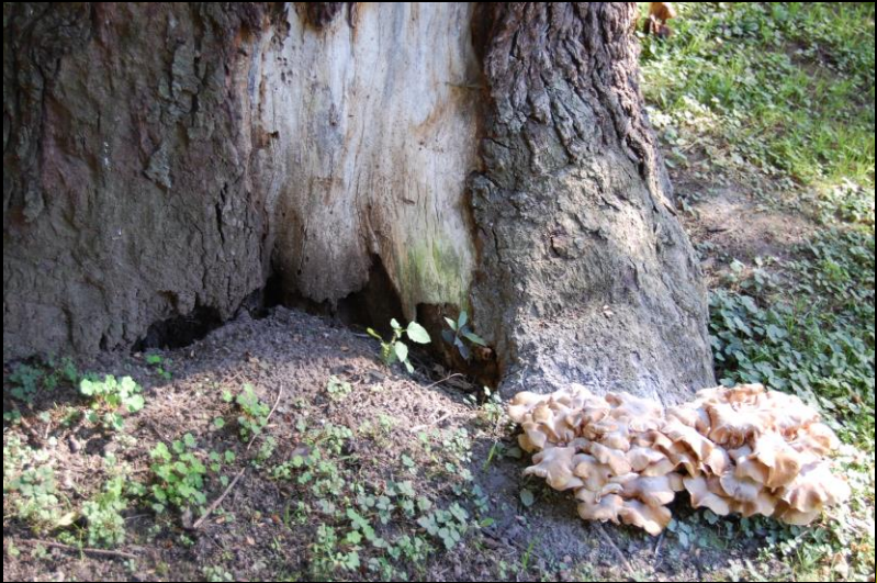
Carpofori autunnali di Armillaria spp.

I corsi proposti e le varie tematiche affrontate mirano ad aumentare le conoscenze e le competenze di tecnici, professionisti e operatori del settore ai vari livelli. Pregnante nella filosofia di queste attività è il costante legame e stretto rapporto fra innovazione e mondo del lavoro.