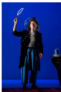
12.00 Magico Camillo e la Scienza 12.30 rientro a scuola